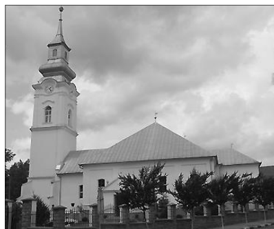
A margittai református templom.

Számadatok igazolják egyházunk ugárásszerű lelki fejlődését. Húsvétkor zsúfolásig megtelt a templom, s a kb. 530 személyből 430-an vettek úrvacsorát. Ennyien talán csak 17 évvel ezelőtt voltak, csak akkor 2005-nél is több egyháztagunk volt.