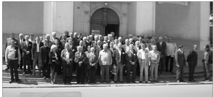
A konferencia résztvevői. Az augusztusi vizontlátás reményében kíván áldásos munkálkodást az erdélyi presbitereknek a partiumi küldöttség