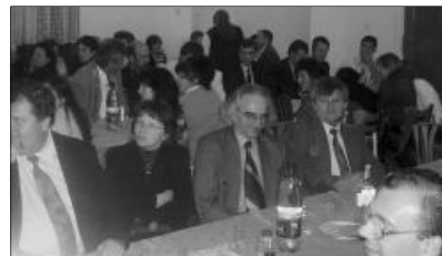
A negyedik alkalommal szervezett jótekonysági bál a hadadi Dégenfeld Református Egyházi Központ megújulását szolgálta

Az ünnepi beszédek után kulturális műsorra került sor, melynek keretében először a Hadadi Általános Iskola tanulói léptek fel, majd a szilágynagyfalui Bíró Bánffy György Kulturális Társaság Kék Nefelejcs színjátszó csoportjának ünnepi előadása következett.