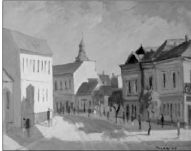
Tolnay Tibor: Teleki utca, Nagyvárád

Miért választotta ki őket az Úr? Azért, hogy szétküldje őket a világba. Jézus is küldött, az Atya küldötte, az apostolok is küldöttek, őket Jézus küldte. Üldöztetés lesz a sorsuk, mert nem lehetnek nagyobbak Mesterüknél, erről azonban egyelőre