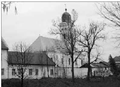
Egyházkerületünk Nőszövetsége a Nagybánya-óvárosi templomban tartja idei konferenciáját

Ezúttal szeretném tájékoztatni asszonytestvéreimet arról, hogy a Királyhágómelléki Református Egyházkerület Nőszövetségének XI. konferenciáját 2010. július 24-én tartjuk. Helyszín: Nagybánya-Óvárosi református templom.