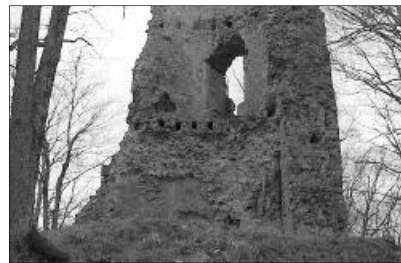
Menteni a menthetőt. A várasfenesi Bélavár romjai

A Fekete-Körös völgyének felső szakaszán hét református anyaegyház, ill. társ-egyház és a hozzájuk tartozó kis szóróványközösségek (Belényes, Belényessonkolyos, Belényesújlak, Kisnyégerfalva, Jánosfalva, Köröstárkány, Magyarremete, Várasfenes, valamint Magyarcséke) valamennyien református nyelv- és vallási szigetek, amelyek évszázadok óta különös hagyományokat,