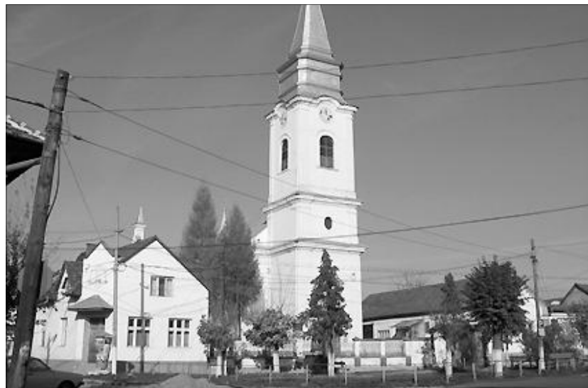
A belényesi református templom

(Zsiskú János – Miklós János: Őrtornyaink a Körös völgyében , 1996)