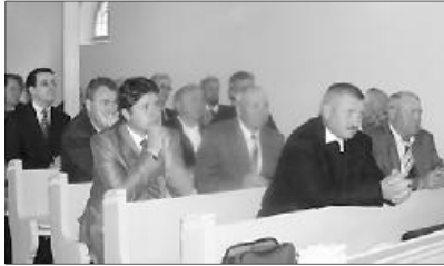
Tizenhatodik alkalommal került sor a hegyközi presbitertalálkozóra