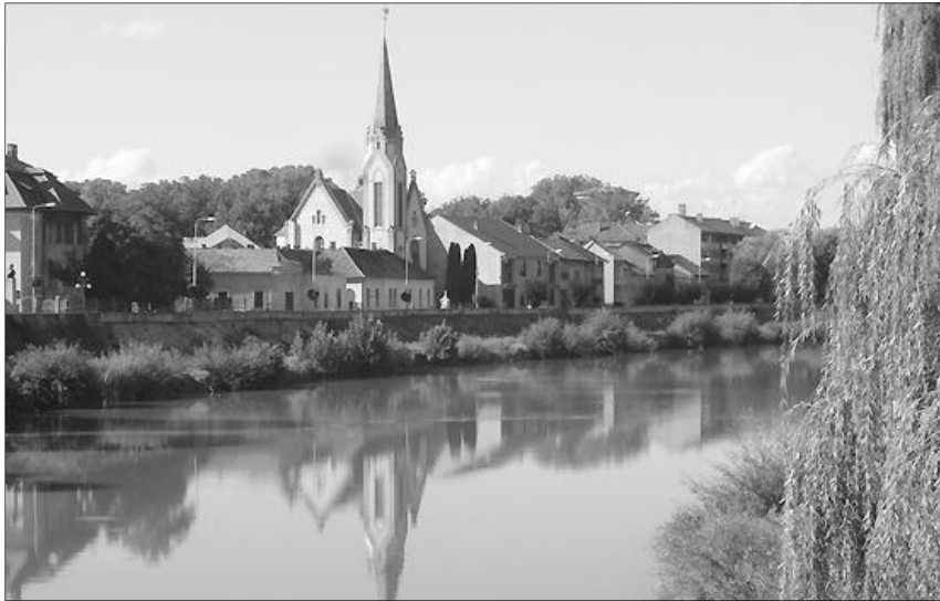
A lugosi református templom

Korunk aktuális, mindennapos kérdéseire nyújt Biblián alapuló válaszokat a Romániai Református Egyház Zsinatának bioetikai témákról szóló egyházi tanítása. A házasság, család, nemiség kérdéseit tárgyaló hatodik részzel áprilisban megkezdett sorozatunk a végéhez érkezett.