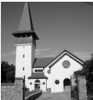
A Nagyvárad-réti református templom napjainkban.