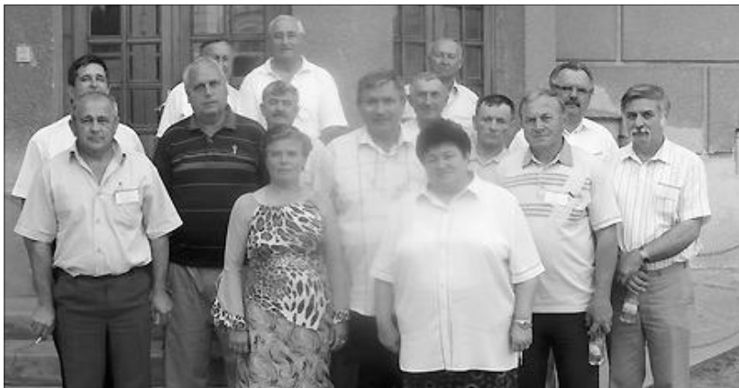
A partiumi és erdélyi küldöttség egy csoportja