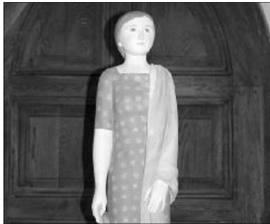
Kós András: Vasárnap

Mi a cél? Az embereket megnyerni Krisztusnak. Jézus szavára a halak sokaságát fogták ki, pedig előbb Péter panaszkodott arra, hogy egész éjjel fáradoztak, mégsem fogtak semmit. Mit jelent ez? Azt, hogy