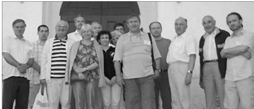
Magyarországról, Kárpátaljáról (ők az első napon készült képen még nem szerepelnek), Erdélyből és a Partiumból érkeztek a laptalálkozó résztvevői