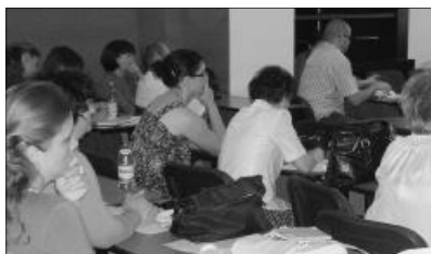
Huszonheten vettek részt az idei továbbképző tanfolyamon

ISKOLAI GYŰJTÉS ÁRVÍZKÁROSULTAK RÉSZÉRE. Az egyházkerület tanügyi osztálya felkérte az egyházkerület tanintézményeit, hogy szervezzenek gyűjtést az árvíz-károsultak megsegítésére. Tanintézményeink alkalmazottai és diákjai jövőtől a következő összegek gyűltek össze: Nagyváradi Lorántffy Zsuzsanna Református Gimnázium: 1.000 RON és 1.050 HUF; Szatmári Református Gimnázium: 1.000 RON; Zilahi Református Wesselényi Kollégium: 250 RON; Partiumi Keresztény Egyetem: 1.100 RON. Összesen: 3.350 RON és 1.050 HUF.