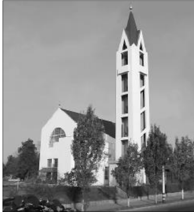
A Várad-rogériuszi református templom