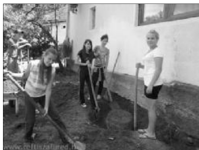
Szeretetmunkával segítettek a tiszafüredi ifjak

Högye Gál Róbert helyi lelkipásztor meghívására fizikai munkavégzésre érkezett a lelkes csoport a Szilágyországba, azzal a céllal, hogy az Ige közelében maradván, szépségek, építsék a parókia környékét. A reg-