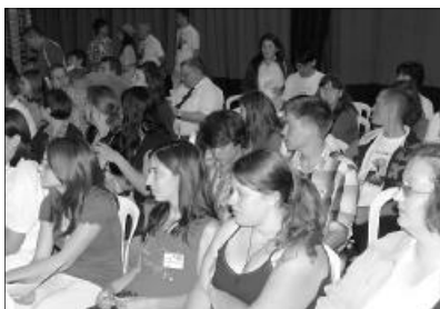
Vidám hangulatban telt a református gimnáziumok seregszemléje

Zárónyilatkozat – Mi, a Kárpát-medence magyar református középiskoláinak küldöttei – igazgatók, tanárok, diákok – 2010. július 7-10. között, tizenötödik alkalommal találkoztunk, ezúttal Miskolcon, a Lévy József Református Gimnázium és Diákotthon alapításának 450.