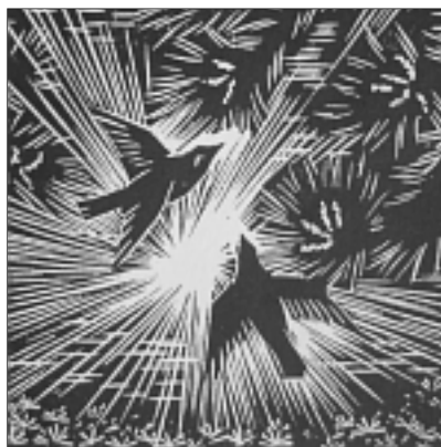
Gy. Szabó Béla alkotása