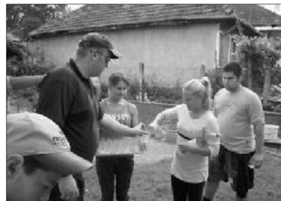
A frissítőről a lányok gondoskodtak

A füredi ifjúság a faluból érkező további segítőkkel jól megértették egymást. A közös munka révén barátságok születtek, ismeretségek kötődtek. Benépesült a parókia és környéke a munkát végző 25-30 emberrel,