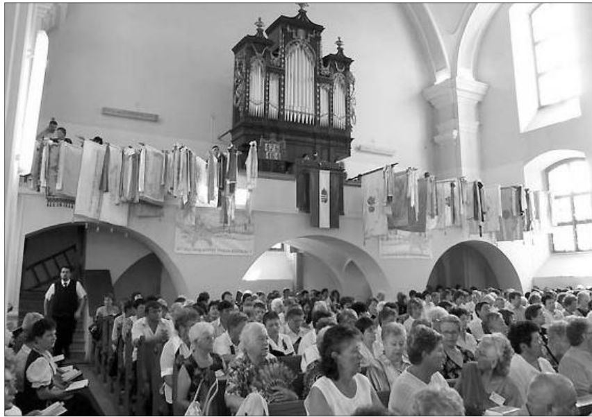
A hagyományoknak megfelelően zászlóikat is vitték a konferenciára a jubileumi együttléte résztvevői

Rendszerváltás utáni újjászerveződése óta 11. nyári konferenciáját tartotta a Királyhágómelléki Egyházkerület Nőszövetsége július 24-én, a Zazar partján fekvő Nagybánya-Óvárosi református templomban. A jubileumi együttlétre mintegy 1200-an érkeztek az egyházkerület valamennyi egyházmegyéjéből, valamint a határon túlról.