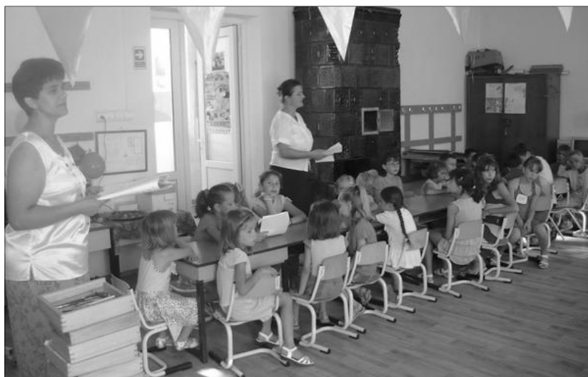
Énektanulás a hegyközpályi gyermekbibliahéten