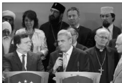
Vallási vezetők az Európai Parlamentben

Jerzy Buzek EP-elnök bemutatta az Európai Parlament vallási és egyházi ügyekkel megbízott alelnökét, Tőkés László erdélyi képviselőt, akit a diktatúrák elleni küzdelem, illetve tágabb értelemben az emberi jogokért való következetes kiállás élharcosaként jellemezte. Az ő példájából, egyházának a Ceaușescu-rezsim megbuktatásában vállalt szerepéből, valamint több más, hasonló esetből is kitűnik, hogy az egyházak társadalmi szerepvállalása minő fontossággal bír – mondta a lengyel – protestáns – elnök.