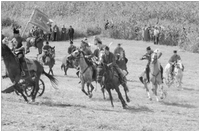
Idén is a történelmi hűség jegyében zajlott le a látványos csataimitáció