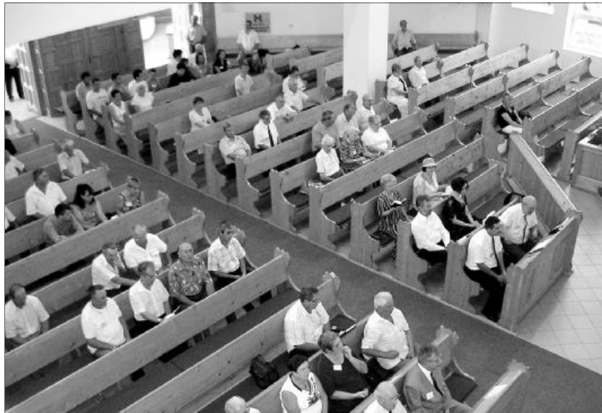
Helyszín és résztvevők. Idén is tartalmas előadásoknak örvendhetett a presbiterek közössége

Augusztus utolsó hétvégéjén, pénteken és szombaton zajlott a Királyhágómelléki és a Tiszántúli Egyházkerület közös szervezésében létrejött presbiteri konferencia, a nagyváradi-rogériuszi református templomban. Az idei konferenciát az Erdélyi fejedelmek, akik a magyar református egyházat szolgálták téma jegyében az egyháztörténelmi előadások határozták meg.