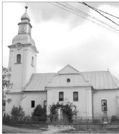
A szilágyballai református templom

A testvérgyülekezeti kapcsolat 1991-ben kezdődött a Református Világtalálkozó sárospataki rendezvényén, ahol először az ózdi, majd később a Kazincbarcika-alsó református gyülekezettel ismerkedtünk meg. Ekkor Kazincbarcikának már volt egy felvidéki testvérgyülekezete: Tornalja. Néhány közös találkozót követően megfogalmazódott bennünk az igény, hogy bővítve a kört, legyen hármas a mi testvérgyülekezeti kötődésünk. 2004-ben egy nagyszabású hármas találkozó volt nálunk, Szilágyballán, amelyen jelen volt Ft. Tökés László, akkori püspök is, aláírásával is ellátva testvérgyülekezeti megállapodásunkat, amelyre Isten áldását kérte.