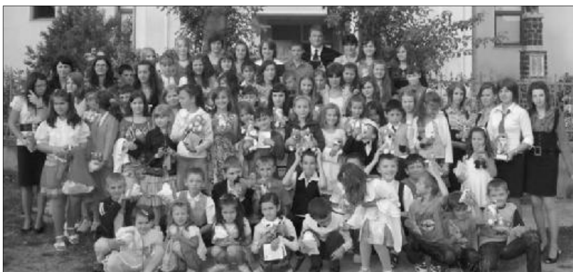
Egy közösségként tapasztalhatták meg, milyen az Isten szerinti igazi ünneplés

A gyermekek megismerkedhettek az Egyiptomból való szabadulás történetével, az ennek emlékére megült Páska ünnepével, amely megvilágította számukra Isten szabadító kegyelmét. A sátoros ünnep kapcsán Istent, mint gondoskodó Atyát ismerhették meg. A kánaeni menyegzőről szóló történet által lehetőségük volt megismerni a zsidó menyegzői szokásokat, valamint a Fiú Isten hatalmát, aki képes ma is csodát tenni életünkben. A pünkösdi történet a Szentlé-