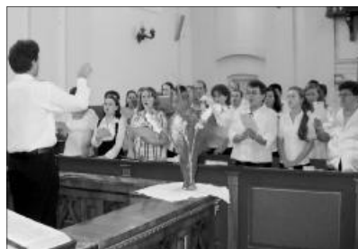
A záróhangversenyen gyülekezeti énekközpontok hangzottak el

Az utolsó három nap már a vizsgák jegyében zajlott. Minden hallgató csoportvizsgát tett, amelyről igazolást kapott, ezzel folytathatja a képzőt a következő esztendőben. Augustus 20-án zajlottak a hangszeres vizsgák, valamint este hétkor került sor a záróhangversenyre. Az ünnepi istentiszte-