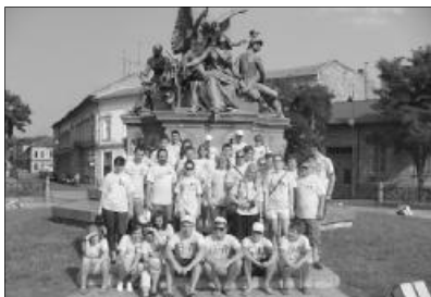
A fiatalok egymás kultúrájával és életszemléletével ismerkedtek

Projektünk másik alapköve a társadalmi szolidaritás és a társadalmi kirekesztettség elleni harc volt. Mivel 2010 a szegénység elleni harc európai éve, ez tükröződött a mi projektünkben is. A csoportok 30 százaléka hátrányos helyzetű fiatalokból állt, akik önrőből nem tudtak volna nyaralni. A projekt által lehetőségük adódott arra is, hogy megismerkedjenek a holland fiatalokkal, egy másik kultúrával és életszemlélettel. Az együtt töltött idő, a közös tevékenységek ismét erősítették az összetartozás érzését. A