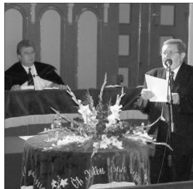
A vasárnap délelőtti istentisztelet egyik momentuma

KEDVES OLVASÓINK! Az idei nyár egyházi eseményeiből szeptemberi lapszámainkban már több tudósítást olvashattak. Az időközben érkezett beszámolóknak is örömmel adunk helyet. Megszokhatták, hogy időnként mellékletekkel „feszoghatták” lapunk 8 oldalának szűk és rég kinőtt kereteit. Ezúttal Református élet című rovatunk jelentkezik négy oldalas melléklettel. Fogadják szeretettel. A szerk.