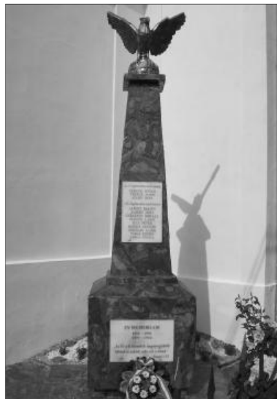
Emlékmű a hősöknek. A turulmadaras obeliszket májusban avatták fel