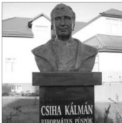
Csiha Kálmán érsemjéni szobra.

Egy rövid emlékezés nagyon távol áll valaki egész életének, életművének felmérésétől. Arra essék hát a hangsúly, hogy az