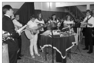
A szeptemberi könyvbemutatón a helyi ifjak is szolgáltak