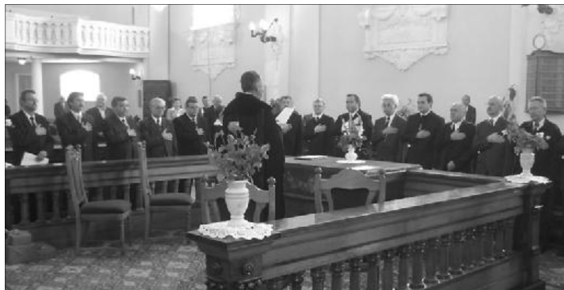
Az eskütétel pillanatai a Szatmárnémeti-Láncos templomban