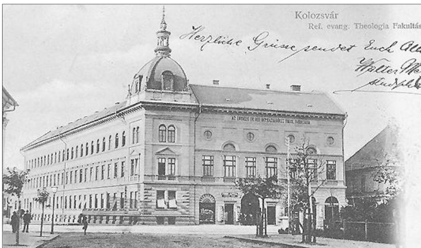
„Tápláló anyja a mintegy másfélmilliósi erdélyi magyarságnak”. A teológia épülete a szazadelőn

Jelenleg az akadémia neve: Protestáns Theológiai Intézet, amelynek egyetemi rangját az állam újból elismerte. Két fakultása