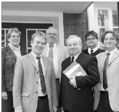
A diakóniai együttműködés lehetőségeiről is tárgyaltak

A testvéri látogatás hagyományteremtő kezdeményezés, a Németországi Református Egyház küldöttsége a közeljövőben felkeresi egyházkerületünket.