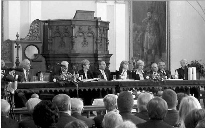
A díj ünnepélyes átadására szeptember 18-án került sor a kolozsvári Protestáns Teológiai Intézet dísztermében.