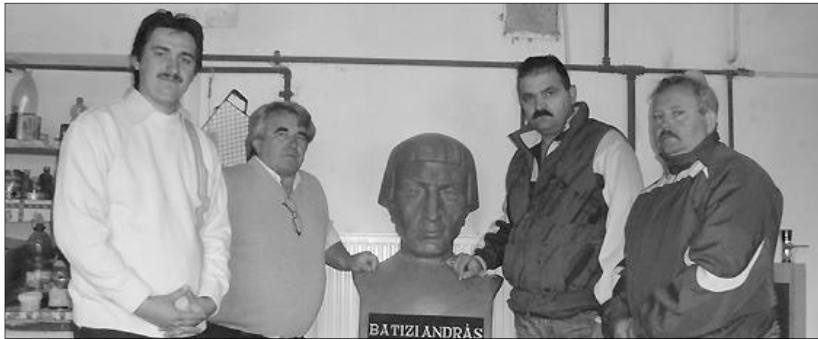
Felelevenítik az 500 éve született reformátor alakját