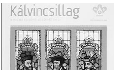
Az egységes református egyház valamennyi egyházrésze bemutatkozik a magazinban

A lap készítői gárdája a kilenc Kárpát-medencei egyházrész delegáltjaiból jött össze. A lap szerkesztői maguk közül választották ki a főszerkesztőt, Fekete Károlyt,