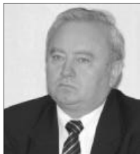
Csúry István püspök

Egyébként az egyházkerületi tisztújítási folyamat, a presbiteri választással már tavaly