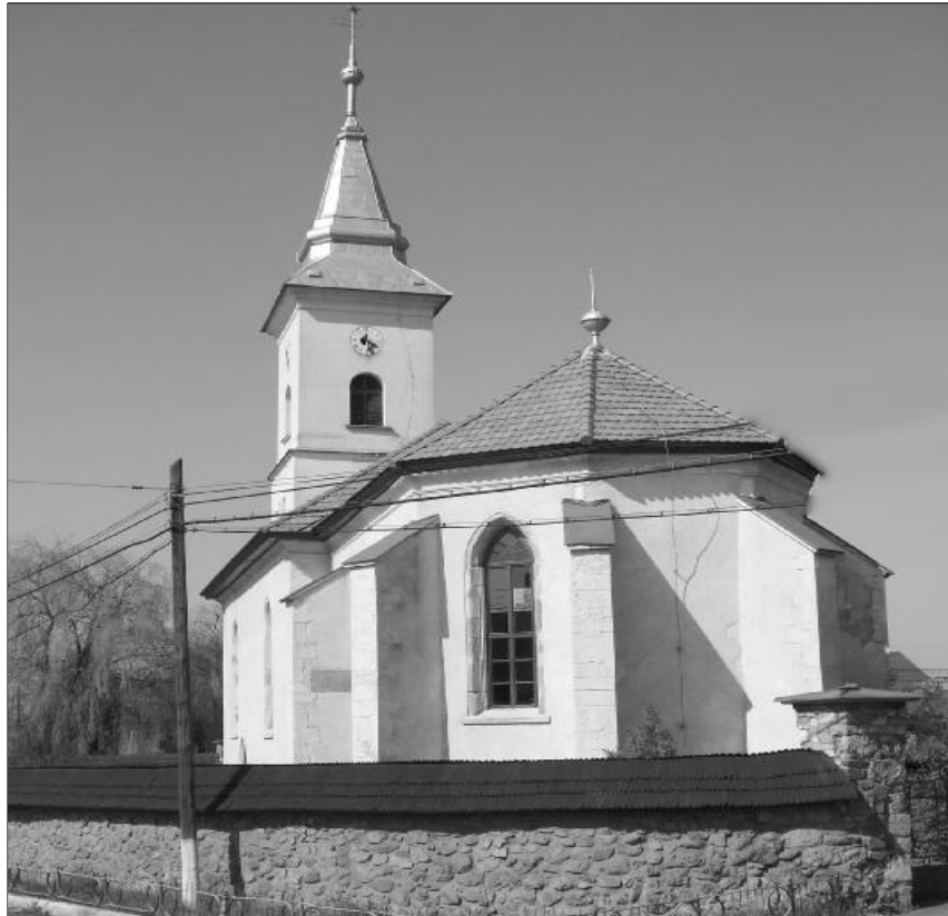
Híres szülőföldre emlékezett templomában a misztótfalusi eklézsia

Ez év elején személyes beszélgetésekben többször hangzottunk, hogy jó lenne megemlékezni Misztótfalusi Kis Miklós születésének 360. és házasságkötésének 320. évfordulójáról, ráadásul idén lelkeszertekezlet szervezésével is soron következünk, a misztótfalusi gyülekezettel. Gondolatainkat szeptember 28-án ültettük gyakorlatba, a Comunitas Alapítvány támogatásával.