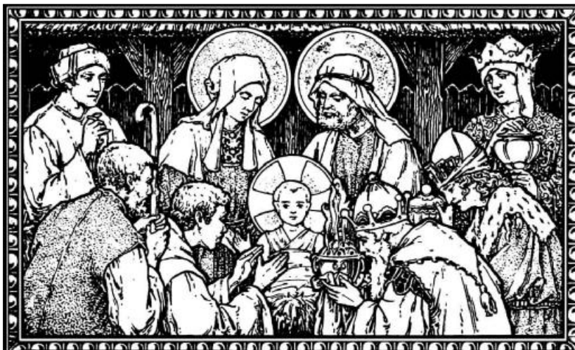
„A nemes Betlehemnek városába’ Gyermek született szüztől e világra” (MRÉ 201a/3).

Olyan gyermeki ártatlansággal bújtunk aztán otthon ágyba, hogy eszünkbe nem jutott volna az éjszaka bársonyos havában otthon is eljövendő angyalra leskelődni. Csak virradatkor az ablakon bekérezkedő világosságban nyílt hirtelen nagyra a szemem. Az asztalon ott állt a fenyő, csillogtak rajta sejtelmesen az aranyalmák, szaloncukrok. A fényes bronzal bemázolt diók és fenyőtobozok a világ legszebb ékségeiként incselkedtek a szememben. Szüleink ébredésére vártunk öcsémmel, sejtettük, az a titokzatos angyal külön ajándékot is hozott nekünk. Olyan szép háziállataink tán soha nem is voltak, mint az ajándékba kapott kirakós kockákon. Ritkán látni manapság dominót, de ha mégis, egy kicsit mindig leülnék játszani. S bár sohasem lettem nagy sakkozó, a sakkasztal látványa mindig eszembe juttatja az anyalt – Anyut –, akinek semmi se volt drága, ha gyermekeiről volt szó. Ugyancsak nagyocská legényke le-