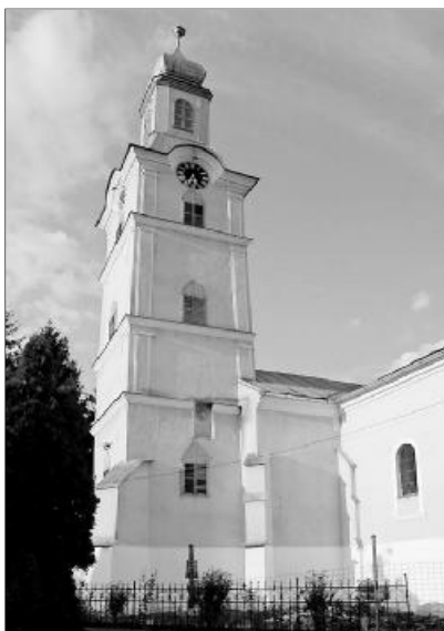
A szilágycsehi református templom

1989. december 26. - Népes gyülekezet közösségében ünnepeltük a ránk virradt karácsony másodnapját. Megjegyezni kívánom, hogy bejelentkezett légátusunk valamilyen ok miatt nem érkezett meg Szilágycsehbe, így egyedül maradtam az ünnepi szolgálattal. Ezen az istentiszteleten megismétltem a tegnapi hirdetést, majd ebéd után kimentem Menyőbe. Tőkés Lászlót a menyői ortodox templomban találtam meg. A református istentisztelet után az ortodox pap és hívei áthívták templomukba, ahol a román tévé riporterei felvételt készítettek az általuk tartott ökumenikus istentiszteletről.