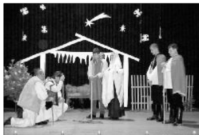
„Mi azért e felségben, / Emberré lett Istemben: / Higyjünk mi egy reménységünkben.” (MRÉ 190/8)

Kis pásztor: Halod, öregapám, az angyalok énekelnek. Új királyunk született az éjjel.