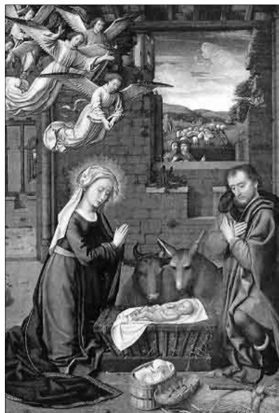
„Dicsérjük a szent angyalokkal, / Imádjuk a hív pásztorokkal” (MRÉ 194/3). David Gerard: Születés

Megörült ennek a hírnak Mária, mert ebből megértette, hogy a gyermek lesz a Megváltó, akit minden ember annyira vár. És ő lesz ennek a gyermeknek az édesanyja! Akkor csakugyan ő lesz a földön a legáldottabb anyuka. De egyvalamit nem értett Mária: – De hát ki lesz a gyermek apja? Józseffel még nem vagyunk összeházasodva! Az angyal azonban így válaszolt: – Nagy és csodálatos titok ez, Mária. Isten maga lesz a gyermek apja, hogy ez a gyermek örökké élhessen. Nem lesz közönséges gyermek. Isten Fiának fogják hívni. Mária mély tisztelettel fejet hajtott és így felelt: – Az Isten szolgálóleánya vagyok. Történjék minden úgy, amint mondottad.