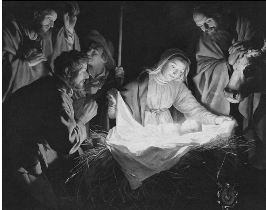
„Jer, mindnyájan örüljünk, / És szívünkben vigadjunk, / Mert született Úr Jézus nekünk.” (MRÉ 190/1) Gerard van Honthorst: Születés

Ha a házamat fenyőágakkal, gyertyákkal, égőkkel és csilingelő harangocskákkal díszítem fel, de a családom felé nincs bennem szeretet, nem vagyok egyéb, mint díszlet-rendező.