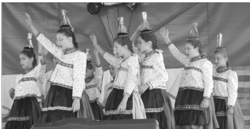
A Partiumi Ifjúsági néptánc találkozót második alkalommal rendezik meg, szeptember 25-én, Varsolcon

IKE Várom az Urat Adventi Zenefesztivál (Erdély, Kolozsvar, december 4.); KIE Advent a Sóvárban (Balatonyörök-Sóvár); KRISZ Évzáró, (Kárpátalja, Balazsér, december 30–31.).