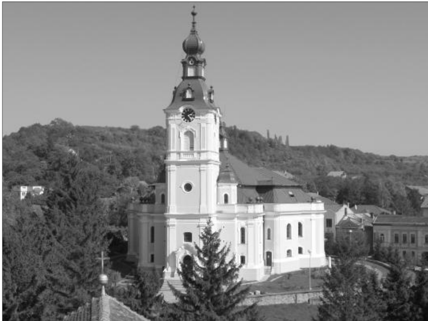
A Zilah-belvárosi református templom. Antal Attila felvétele

Földi életünk egyik legnagyobb ajándéka a család, az otthon. Nem hiába írta egyik erdélyi írónk, azért vagyunk a világon, hogy valahol otthon legyünk benne. Nagy dolog hazaérkezni, nagy ajándék, hogy a világon van egy hely, ahol szeretnek bennünket, ahol hazavárnak, ahol szeretet, jószág és lelki melegség vesz körül.