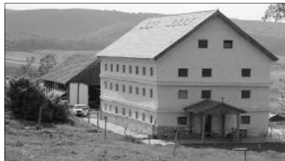
A Magyarórzdi Drogterápiás Otthon