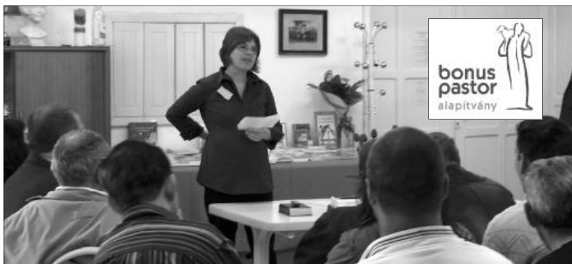
Keresztyén lelkeséggel és a segítő szakma eszközeivel nyújtanak segítséget a függőségekben szenvedőknek és hozzátartozóiknak

A fenti idézetek nehéz utakat megjárt emberek vallomásának töredékei. Ki szen-