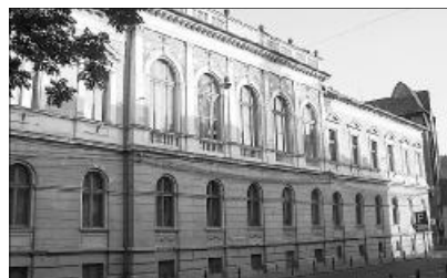
Az idei Zsuzsanna bálón összegyűlt adományokat a Lorántffy Gimnázium épületének felújítására ajánlotta fel az Egyházkerület

EGYHÁZKERÜLETI SZÍNJÁTSZÓ TALÁLKOZÓ. A Királyhágómelléki Református Egyházkerület missziói osztálya, a Nagyvárad-Velencei Református Egyházközséggel közösen (ez utóbbi, mint ötlet- és házigazda) egyházkerületi színjátszócsoporthoz találozóját hirdeti meg 2010. november 13-ra. Jelentkezési határidő: 2010. május 1. Elérhetőségek: 0723465499, 0259417285, varadvelence@freemail.hu.