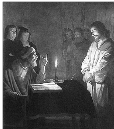
Gerard van Honthorst: Krisztus Kajafás előtt

Kaifás a ruháját szaggatva őrjöng, jelenetet rendez. Mindezt azért teszi, hogy befolyásolja a tanácsosokat, s hogy ne kelljen folytatni az eljárást. Ki kellett volna vizsgálni ugyanis, hogy lehet-e Jézus a Messiás. Mert ha igen, akkor nem történt káromko-