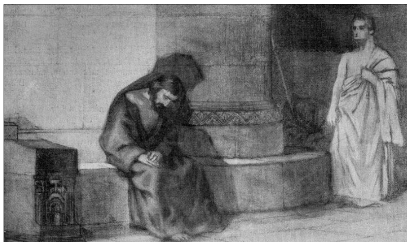
Nagy Zsigmond: Krisztus és Pilátus

Amint Pilátus meghallotta a Galileai szót, pompás ötlete támadt arra, hogyan szabadulhatna meg az ügytől. Ha Jézus galileai, akkor Heródes Antipász - aki ekkor éppen szintén Jeruzsálemben tartózkodott - eljárhat ügyében. Egy adott bűnyűben ugyanis az elkövetés helye szerinti hatóság kívül a vádlott lakóhelye szerinti hatóság is eljárhatott. Pilátus - kihasználva ezt az illetékességi szabályt - Jézus ügyét áttette Heródeshez.