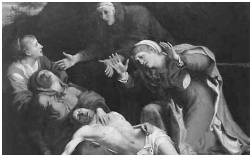
Caracci: Krisztus siratója