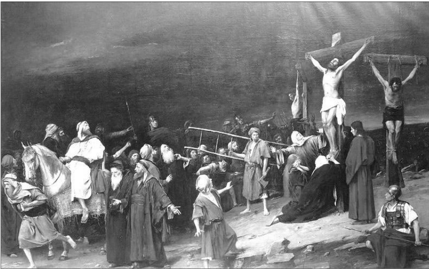
Munkácsy Mihály: Golgota című alkotása

A húsvét azt hirdeti, hogy Krisztus feltámadt és él. Élő, szerető, cselekvő Urunk van. Aki eszerint él az keresztyén. Ezzel ellentétben a nagyszombat arról szól, hogy Jézus a sírban van, mert meghalt. Halott az Úr. Van, de a sírban nem lát, nem hall, nem segít. Aki eszerint él az a nagyszombatista.