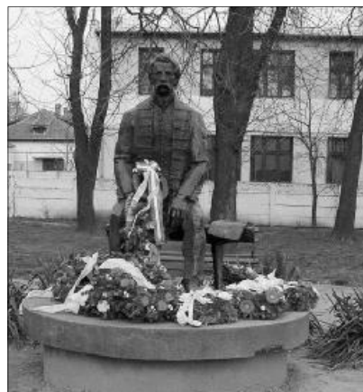
Arany János szobra Nagyszalontán

Arany János életművének minden darabja hitét és református gondolkodását tükrözi. Sokat emlegetik a hatalmas Toldi-trilógiát. Méltán. Rövid balladái okán azonban „a ballada Shakespeare-jének” nevezhették el. Minden egyes balladája bibliai alapkérdést fogalmaz meg. Témája: a bűnbűnhődés-kegyelem. Mindnyájunknak számot kell adnunk életünkről a nagy Isten színe előtt. Nem emberi mérce, hanem az is-