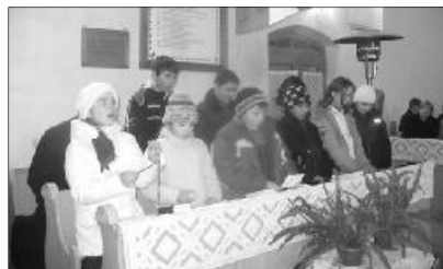
A gyermekek verses-zenés műsora