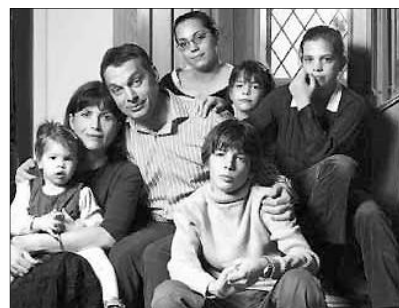
A régi-új miniszterelnök családjában

– Megkereszteltek, fölvettek a keresztény közösségbe, elsősorban a nagyszüleim ragaszkodásának eredményeképpen, de nem kaptam vallásos nevelést, vallástalan közegben nőttem fel, még az egyetemi éveim elején is így volt ez, amíg meg nem ismerkedtem a későbbi feleségemmel, aki viszont egy gyakorló katolikus családból származik. Elég hosszú utat tettem meg, hogy azt a mondatot ki tudjam mondani, hogy hívő keresztény ember vagyok. Volt az életnek egy pillanata, amikor úgy éreztem, hogy ami elmaradt, azt be kell pótolni, a dolgoknak a helyükre kell kerülniük – akkor konfirmáltam. Nem tudtam mindig, de mindig éreztem, és ma már tudom, hogy addig is velem volt az Isten, akkor is, amikor nem figyeltem rá, és azért tettem akkor a fogadalmat, hogy ez ne is változzon meg, maradjon velem, és azokkal, akik