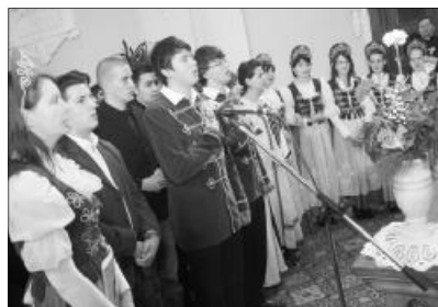
A diákok ünnepi műsora