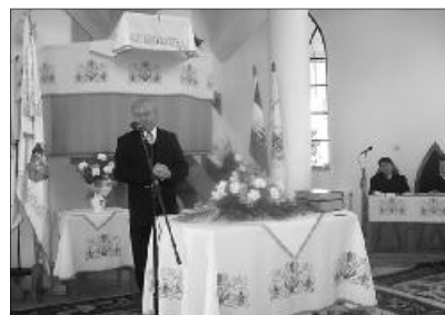
Csúry István püspök, előadásában a nőszövetségek fontosságát is hangsúlyozta

Húsz éve, 1990. március 23-án a kolozsvári teológia dísztermében tizenhárom lelkesítő gyűlt össze, ahol elhatározták, hogy ki-ki a saját egyházmegyéjében megalakítja a nőszövetséget. Az elhatározást tett követte, bár még ma is vannak olyan egyházközségek, ahol nincs szervezett formája a nőszövetségnek. A jubileumi év alkalmából évkönyvet adnak ki, mely a tervek szerint tartalmazza az elmúlt esztendő fontosabb eseményeit. Várják a nőszövetségek bemutatkozó írásait, a zászlók bemutatását, verseket, imákat, fényképeket, melyeket legkésőbb május 1-ig az egyházmegyei nőszövetségi elnökökhöz kell eljuttatni.