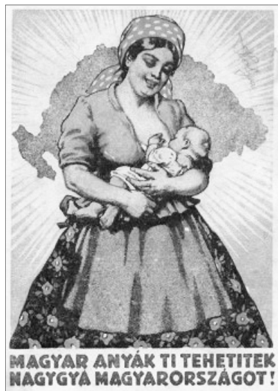
Aldás népszerűség egy Trianon utáni plakáton

Emlékszünk-e, emlékezhetünk-e arra, hogy a történelmi ország közepén élők, mit észleltek az „akkort” követően? Bizonyára mindenkinek fáj a nemzethalált jövődőlő június negyediké, és a délután fél ötöt jelző harangszó. Egy épeszű magyar ember, vagy egy hungarus tudatú, de más anyanyelvű ember akkor nem érezhetett mást, csak gyászt. Idézhetjük Karinthy Frigyesnek a levágott végtagokból kisugárzó fájdalomról fiának írt megrázó levelét, vagy Juhász Gyulának verssorait a tragédiáról: „Nem kell beszélni róla sohasem, / De mindig, mindig gondoljunk rá”. Mégis sokan voltak olyanok, akiknek csak annyit jelentett Trianon, hogy megváltoztak a gazdasági és a piaci viszonyok, emiatt szegényebbek lettek. Ráadásul a nyakukba szakadt néhány szerencsétlen menekült és otthonából kikergetett rokon, akiket nekik kellett el-tartaniuk az állam balsikerű politikája miatt. A Ferencvárosi rendező pályaudvaron pedig évekig álltak a vasúti teherkocsik tele, rokonság nélküli menekült felvidékiekkel, erdélyiekkel. Az események és a következmények megelőli egyszerre könnyeztek és káromkodtak. Az ország közepén élők annak örültek, hogy nem a széleken éltek az elcsatolások, akik pedig az új államhatár miatt a szélre kerültek, hálát adtak az Istennek, hogy nem két kilométerrel beljebb