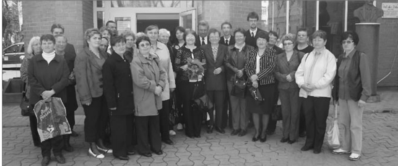
Az Áldott Orvos küldöttei. Több gyülekezet is képviseltette magát a szatmári kórházmisszióban

Nagyhét második napján a Szatmári Egyházmegye néhány lelkipásztora és nőszövetségi tagja missziós szolgálatot végzett a szatmárnémeti 2-es számú Megyei Kórházban, közismert nevén a régi kórházban. Akárcsak legutóbb karácsony előtt, most is az örömhírt vitték a kórházban fekvő betegeknek.