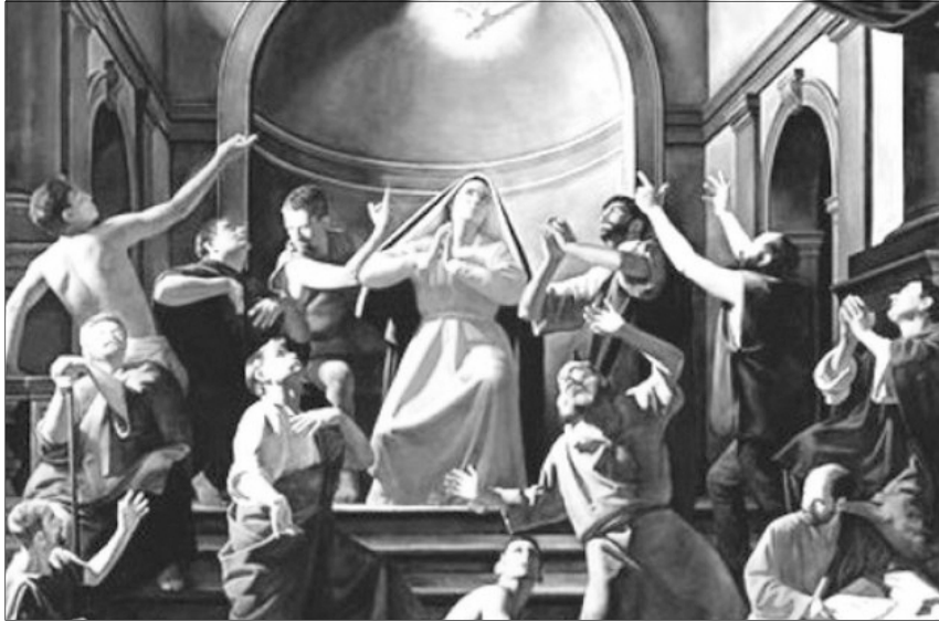
„Es lőn nagy hirtelenséggel az égből mintegy sebesen zúgó szélnek zendülése, és eltél az egész házat, ahol ülnek vala.” (ApCsel 2,2) Kisléghi Nagy Ádám: A Szentlélek eljövetele

Húsvét után ötven napra beteljesült Krisztusunk ígérete. Tanítványaira rendkívüli módon kitöltötte Szentlelkét, Istennek égi tüze által megtisztultak, félelmük eloszlott, Jézus szava ragadta meg őket és bátran hirdették a megfeszített, feltámadott, jelenlevő Úr Jézus Krisztust!