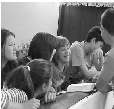
Fiatalok a völcsöki templomban