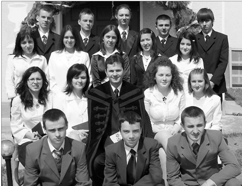
A lompéti ifjak ismét bizottságot tettek Krisztusba vetett hitükről