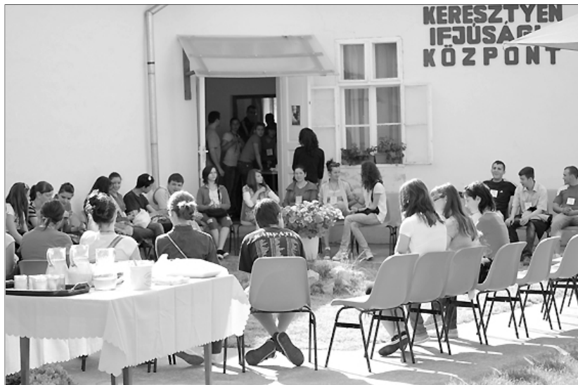
Ismerkedés a belényesújlaki Keresztyén Ifjúsági Központ udvarán