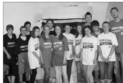
Menyőbe is ellátogattak a völcsöki ifjú önkéntesek