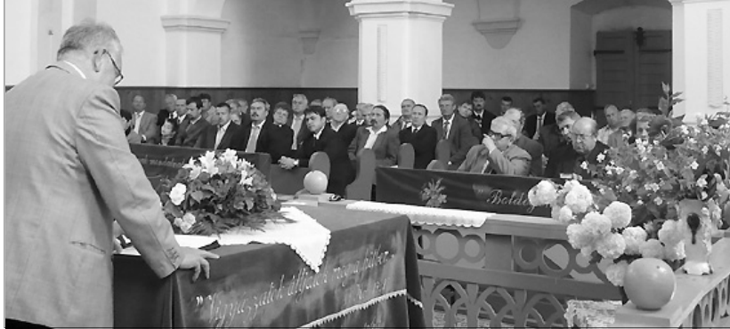
Tizenhét gyülekezet képviseltette magát a konferencián

Az Aradi Egyházmegye Presbiteri Szövetségének idei első konferenciáját május 14-én, szombaton tartottuk meg a Kisperegi Református Egyházközség templomában. A találkozón arra a kérdésre kerestük és kaptuk meg a választ, szükség van-e a folytonos reformációra?