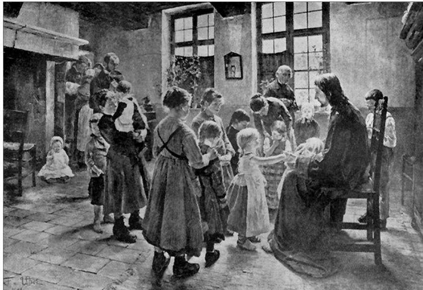
Uhde Frigyes: Engedjétek hozzám a kisdedekeket

„Engedjétek hozzám jönni a gyermekeket” (Mk 10,15). Veszély fenyegeti a társadalom legkisebb sejtjét, a családot. Sokszor hallunk és kongatunk hasonló vészharangot. Konferenciát konferencia követ a család jövőt ígérő és hordozó megtartó erejéről és mégis egyre kevesebb a házassághoz, több a temetés, mint a keresztelezés.