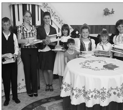
A szavalóverseny díjazottjai