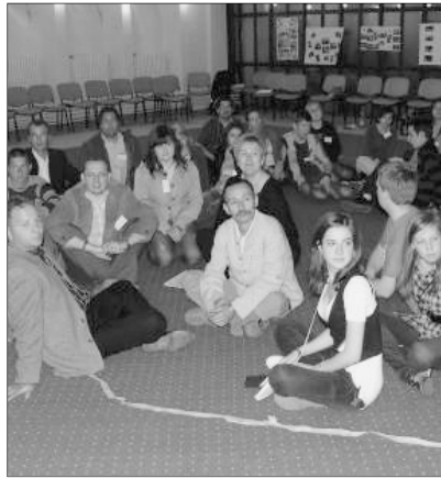
A királyhágómelléki küldöttség. Szerzőnk lent balról az első

Már hónapokkal ezelőtt magasabb ifjúsági vezetői fórumokon szó esett arról, hogy a kapcsolat hiánya, a találkozás hiánya sok