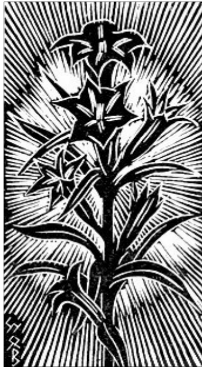
Gy. Szabó Béla alkotása

adta a Törvényt, hogy a választott népet magához kösse, ehelyett a választott nép kisajátította magának Istent. A Törvényből vezette le igényét a világhatalomra, Istent beleépítette saját vágyaiba. A Törvény magyarázóik egyre több előírást fűztek az eredeti isteni rendelkezéshez és ezekhez az emberi hozzátoldásokhoz kötötték az üdvösséget, szinte már az eredeti, tiszta, igazi tanítás elveszett, vagy sokadrangúvá vált,