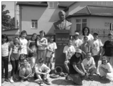
Csoportkép az érsemjéni Csiha-mellszobor mellett