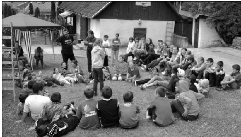
Szamosardón sokéves hagyománynak örvend a bibliahét