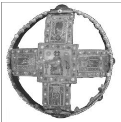
A Szent Korona felülnézetből

1000-ban István egy zseniális diplomáciai lépéssel Szent Péternek ajánlotta fel or-