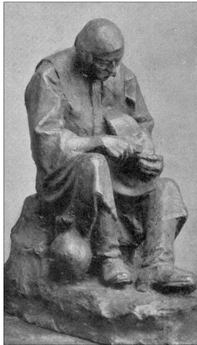
Liipola György: Kenyér