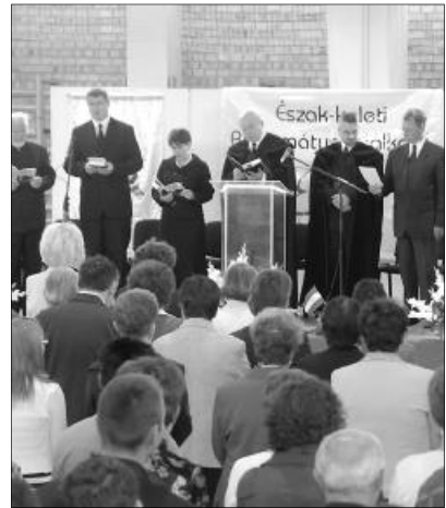
Nem hagyható ki Isten az életünkben. A záróistentiszteleten Csűrű István püspök hirdetett igét

AJTÓNYÍTÁS A TEMPLOMON KÍVÜL ÁLLÓKNAK. Áhítatok, evangelizációk, koncertek, pódiumbeszélgetések, kórustalálkozó, táncház, bábszínház, bibliodráma és megannyi színes program várta az ÉRT mintegy kétezer résztvevőjét. A szervező Zempléni Egyházmegye célként azt tűzte ki, hogy „a Kárpát-medence északkeleti régiójának reformátusai megmutassák magukat egymásnak és a világnak. A találkozó ugyanakkor ajtónyitás is a templomon kívül állóknak.”