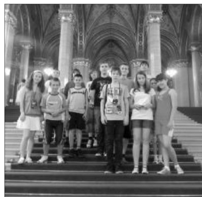
Felejthetetlen élmények az Országházban

A keddi nap ennyi programot engedett magába sűríteni; szerdára hagyva a Debrecenbe tett látogatást. Mielőtt azonban elhagytuk volna Budapestet, elmentünk az Ability Parkba, ahol fogyatékkal élők vezettek át minket különböző programokon, melyek során átérezhettük ezeknek az embereknek a nehéz sorsát, és a velük való be-