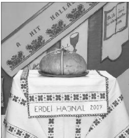
A szilagyilompéti református templom úrasztala újkenyér ünnepén

A kenyérgond a Krisztussal való közösségekben oldódik meg úgy a közösségek, mint az egyének számára. Jézus határozottan kijel-