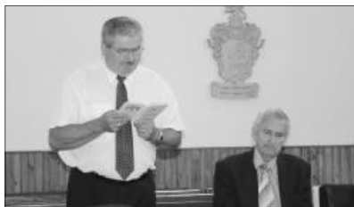
A lelkész-költő saját maga olvasott fel verseiből

A burnout okai közül az előadó elsőségre a bizonyítani akarást emelte ki. Az emberek elvárásai különbözőek, a lelkész bármit tesz, van olyan csoport, amelyiknek az nem tesz. Sokan úgy gondolják: az a természetes, ha a pap jó dolgokat tesz, azért nem kell megdicsérni. A lelképásztor munkájának soha nincsen vége. Nem látja a visszajelzést, ezért épít, méhekkkel foglalkozik, hogy legalább abban látszódjék a munkája. Az elvetett mag a lelki munkában sokszor nagyon későn kel ki. Közben alapvető dolgokat kezd elhanyagolni: család, barát, szabadság. Bármily hihetetlen, nagyon sok lelkész anyagi gondokkal és egészségügyi problémákkal is küzd. E lépcsőfokoknak sokszor a depresszió és a kiégés a következményei.