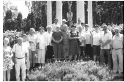
A szatmárcsekei temetőben, Kölcsey Ferenc sírelméknél

A régió igen gazdag irodalmi szempontból is. A Tiszaháton és a Szamosmentén megbúvó kis falvakban igen sok érték található, és mint kiderült csupán karnyújtás-