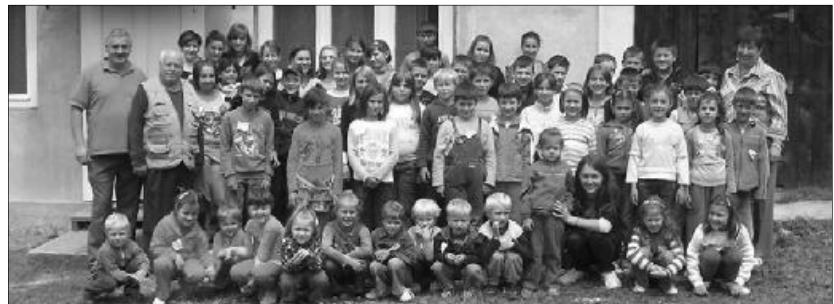
Népes csapat gyűlt össze az érszakácsi bibliahétre