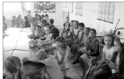
A gyerekeket Krisztushoz vezetni – ez volt idén is a cél