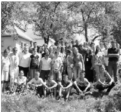
Több évi kihagyás után ismét táboroztak a nagybányai egyházmegye ifjai