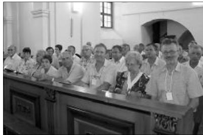
A nagyvárad-i gyülekezetek is képviseltették magukat

A Nagykárolyi Egyházmegye PSZ-elnökének bejelentése a jövő évi kerületi pres-