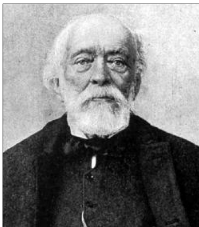
„Engem, ki nem borúlhatok le a magyar Golgota porába, engem October 6ka térdeimre borúlva fog hontalanságom remete lakában látni”. Kossuth arcképe a hangfelvétel készítésének idejéből

E szózat zengését hallom én a messze távolban Hungaria szobrának ajkairól.