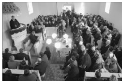
Ünnepi istentisztelettel kezdődött a 2010-es Érmindszenti zárandoklat

ÉRMINDSZENTY ZARÁNDOKLAT – 2010. November 20-án, Ady Endre 133. születésnapja alkalmából a Királyhágómelléki Egyházkerület (KRE) és a Partiumi Magyar Művelődési Céh szervezésében zárandokoltak el a költőóriás tisztelői Érmindszentre, Ady szülőfalujába.