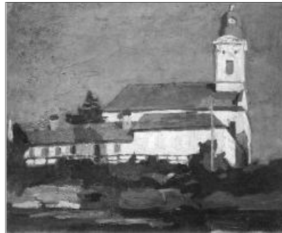
Maticska Jenő: A Híd utcai református templom – Nagybánya

Dániában történt, hogy egy ismeretlen ember nagy összeget adományozott jótékony célra. Mikor azt kérdezték, hogy mi a neve, Danielsen – válaszolta, lakáscímét is megmondta, de kiderült, hogy a név is és a cím is fiktív, mert ez a jó ember rejtve akart maradni. Az újságok is írtak a névtelen és címtelen adományozóról, és valóságos Danielsen-láz tört ki Dániában. Egyik adomány érkezett a másik után, s a földad mindenik Danielsen. Ha valaki pénzt nyomott az utcákon a koldus markába, a koldus így köszönt: köszönöm, Danielsen úr. Az új esztendőben jó lenne, ha sok jót, azaz a jót cselekedné, szívből, mint Mária és József, s