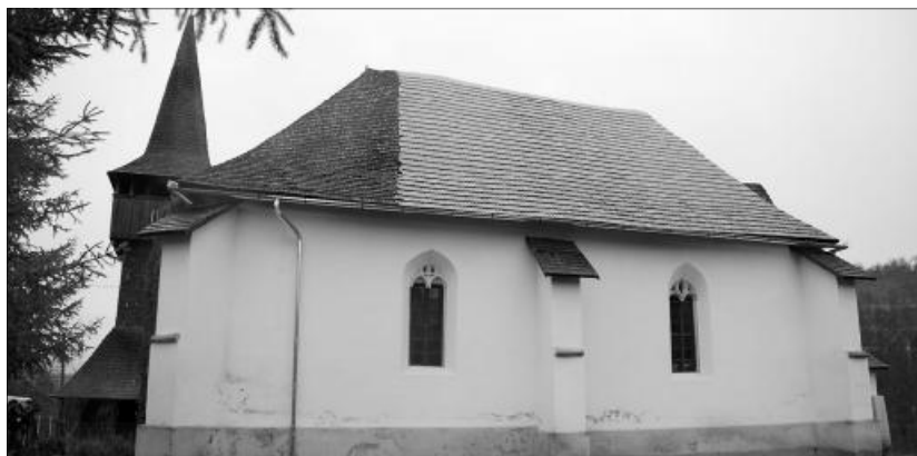
A menyői református templomban is találhatóak reneszánsz faragványok

Az egyházkerület műemléktemplomainak többsége nem egyetlen építési vagy