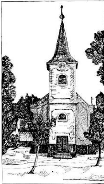
Miklós János: A kisnyégerfalvi templom

Épp azért engedte meg Isten a reformációt és addig használ minket is, míg az értéktelen, a felszínes, az üres, istentelen üveggolyó-csillogástól megtisztul, megszabadul az emberi lélek és élet, míg a gyémánt ragyog, fel nem cseréljük, el nem rejtjük gyémánt-köveinket hamisan csillogó kövekre.