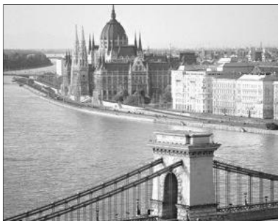
Budapest építészeti értékeit tekintették meg a Nagykaroly-belvárosi eklézsia kirándulói

Délután fél három volt, amikor az Országház melletti parkolóban állt meg autóbuzunk, 50 kirándulóval. Belépve a Parla-