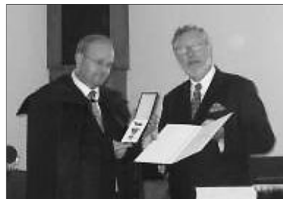
Az elismerés ünnepélyes átadása

✿ ÚJSZÖVETSÉG MAGAZIN FORMÁBAN. Képes magazin formájában jelentették meg az Újtestamentumot Németországban húsvétra. A kiadóban, Andreas Volleritschben két éve merült fel a gondolat, hogy látványra érdekesebb formában kellene közzétenni az Újszövetséget, mert igencsak fáradalmas egy apróbetűs nyomtatású Bibliát végigolvasni. A magazin 244 oldalas, harmincezer példányban adták ki. Nemcsak Németországban, hanem Ausztriában és Svájcban is kapható újságárusoknál, vasútállomásokon, repülőtereken. A kiadó tervezi, hogy az Ószövetséget is hasonlóan képes formában teszi közzé. (MTI)