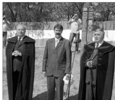
A létrehozandó Református Nemzeti Emlékparkban kopjafa-avatóra került sor