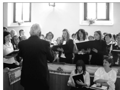
A jubiláló vegyeskar. Számos alkalommal énekeltek itthon és külföldön egyaránt