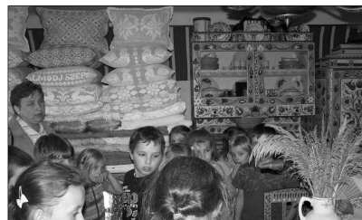
A nyárszói tiszta szobában, kézzel festett bútorok és varrottások között

Következő úti célunk a körösfői jellegzetes kalotaszegi négy fiatornyos református templom volt, mely a dombtetőről vigyázza a települést. Megcsodáltuk a temp-