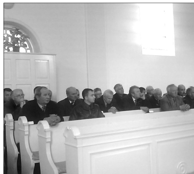
A hat körösközi református gyülekezet első alkalommal tartott kisköri presbiteri találkozót

a híveket, hogy egyenként búcsúzzanak el a megboldogulttól. Mikor belenéztek a koporsóba, mindenki a saját maga arcképét látta benne, s elgondolkozhatott, vajon él-e. Mi is, mikor megszámláltatunk, el kell gondoloznunk, hogy vajon élünk-e reformátusként és magyarként?