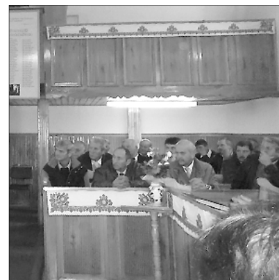
Isten kipótolja fogyatkozásainkat, bizzunk az Ő hűségében