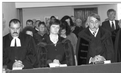
Karánsebesi ünnep. Hetven esztendő a százéves, elszórványosodott gyülekezet temploma

Az igehirdetés a Kol 3,10 alapján történt, amelyből a leglényegesebb gondolatot