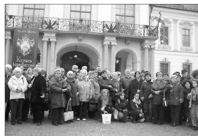
A várad-olaszi nőszövetség gödöllői kirándulása

A csodálatosan felújított gödöllői királyi kastély látogatása felejthetetlen élményt nyújtott mindannyiunk számára. Onnan a főtéri református templomba mentünk, ami szintén Grassalkovits Antal építetett. A templomot a 19. században bővítették, az