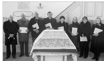
Az 50 éve konfirmáltak