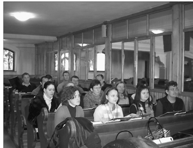
A két szilágysági egyházmegye egyházzenei szakmai napján 18 kántor vett részt

Brüsszelben szervezett nemzetközi biblia-kiállítást, elhozta gyűjteményének egy részét. A kiállítás érdekességének számít a hindu nyelven írt indiai biblia, valamint a koreai és a cigány biblia. (A Vajdaság.ma nyomán)