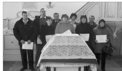
A 25 éve konfirmáltak

Az istentisztelet után került sor a csoportképek készítésére, illetve konfirmálók és társaik számára megtartott szeretetvendégségre.