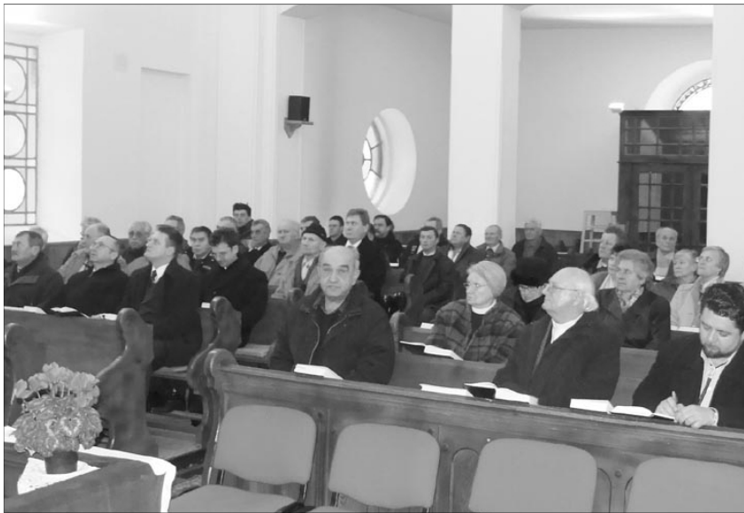
Az egyházmegyei presbiterkonferencia mintegy 60 résztvevővel zajlott.