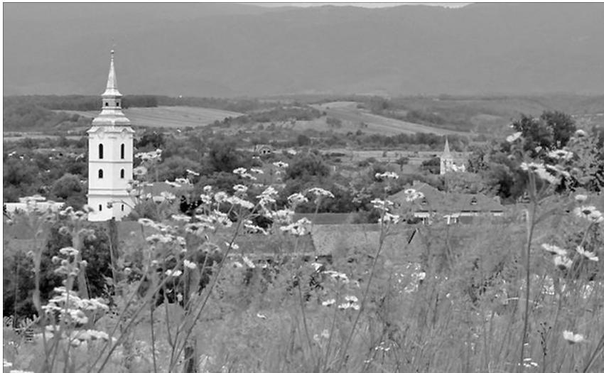
Köröstárkányi tavasz. A Fekete-Körös menti települést az 1330-as években, a pápai tizedlajstromban Tharkand, majd Tarkand néven említik. Alapítói székelő gyeppőzők voltak