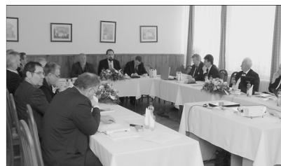
A VI. Magyar Református Világtalálkozó szervezéséről is szó esett.

A megbeszélésen elhangzott, hogy a GK által létrehozott Kárpát-medencei Református Oktatási Alap céljaira indított iskolai gyűjtés során 2010-ben közel 11 millió forint