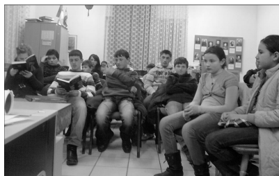
Sok fiatal is bekapcsolódott a 25 órás, maratoni felolvasásba