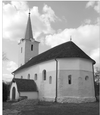
... és remetei református templom