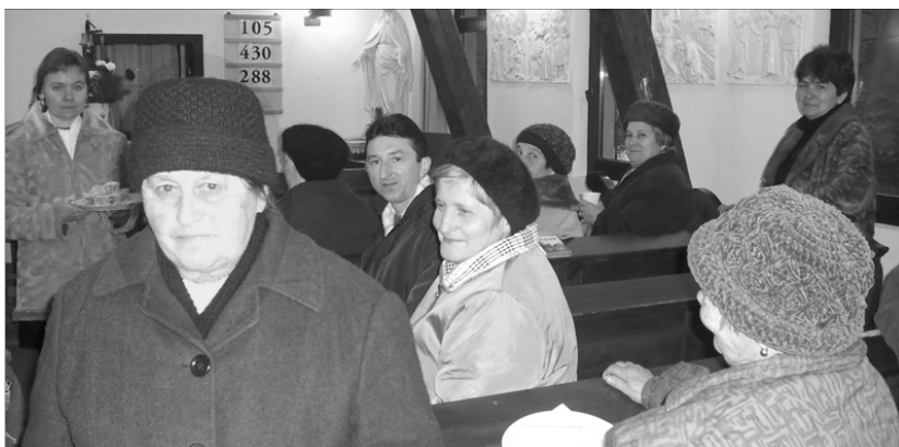
Az imaheti alkalmakat szeretetvendégség zárta