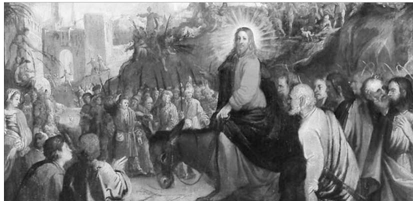
Jézus bevonulása Jeruzsálembe. Észak-itáliai festő alkotása, 1600 körül

„És beméne Jézus az Isten templomába és kiűzé mindazokat, akik árulnak és vásárolnak vala a templomban, és a pénzváltók asztalait és a galambárusok székeit felforgatá. És monda nékik: Meg van írva: Az én házam imádság házána mondatik. Ti pedig latroknak barlangjává tettétek.” (Mt 21,12-13)