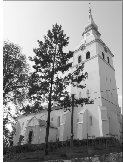
A helyreállított albisi...