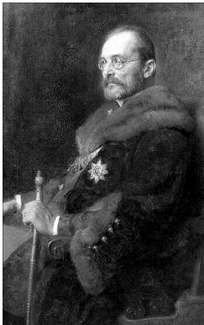
„Menjetek be minden szegény ember házába, hallgassátok meg a gondokkal küzdők panaszait. Iparkodjatok segíteni.”

Tisza István, mikor Geszten tartózkodott, minden vasárnap 10 órakor feleségével és fiával templomba ment. Ilyenkor a gazdaságban az emberek nem dolgoztak. Ekkor teljesen megteltek a geszti református templom padjai. Ami rendkívül fontos volt, hogy a lelkész mindig úgy magyarázta az ígét, hogy azt az egyszerű falusi emberek is megértették és ténylegesen odafigyeltek Isten szolgájára. Tisza is mindig nagy figye-