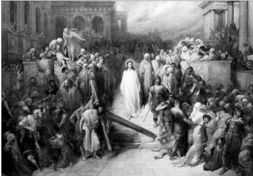
Gustave Doré: Krisztus elhagyja a praetoriumot (1867-1872)

Ma is, nekünk is szól örök érvényű győzelmi hírként: „... én élek, ti is élni fogtok” (Jn 14,19). Krisztus, az élet Ura mondja ezeket a szavakat. Ezzel búcsúzik egykori tanítványaitól, ezt szólja nekünk is a hétköznapi forgatagában megfáradt, kiábrándult, a létért való küzdelem meggyötört harcosainak.