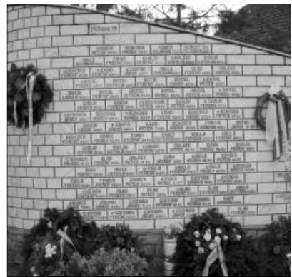
A tárkányi emlékmű, az áldozatok neveivel

KÖRÖSTÁRKÁNY FEKETE HÚSVÉTJA. 1919 nagypéntekén Köröstarványban és Kisnyégerfalván, a Székely Hadosztály visszavonulása nyomán előretörő román félkatonai alakulatok véres magyarirtást hajtottak végre. A tárkányi református templom előtti téren 91, a szomszédos Kisnyégerfalván 17 magyart végeztek ki. Hiteles adatok szerint 204 magyar gyermek jutott árvaságra. Az áldozatok sírköveiről a kommunista román hatalom lekaptatta az 1919. április 19-i dátumot, nehogy feltűnjön valakinek a sok sírkő ezzel a dátummal. A helybeliek 1999-ben leplezték le azt az emlékművet, amelyet az 1919-es öldöklés során, valamint az első és második világháborúban elhunyt tárkányiak tiszteletére emeltek. Azóta minden évben - nagypénteken - ott emlékeznek meg az áldozatokról.