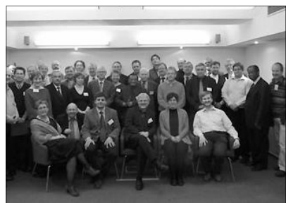
A prágai tanácskozás résztvevői

Európai kulturális kincs és anyanyelvi istentisztelet címmel szervezett konferenciát a Kolozsvári Protestáns Teológiai Intézet április 8-10-én, az évforduló alkalmából. Az 1636-ban kiadott Öreg Graduál olyan liturgikus könyv, amely tartalmazza az úrvacsorás istentiszteleteken, a reggeli és esti imaórákon énekelt, magyar nyelvű gregorián tételeket. Ezt az éneklési módot a 18. századig gyakorolták, tehát viszonylag hosszú ideig meghatározta mind a református, lutheránus, mind pedig az unitárius egyház istentiszteleteinek rendjét. Az előadások mellett gyakorlati bemutató is volt a gregorián liturgiából a reggeli, ún. prima és az esti, ún. vespera istentiszteleti alkalmakra.