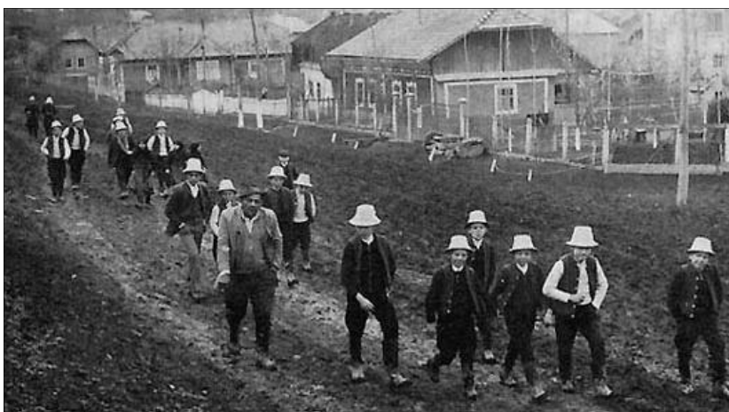
Öntözni induló aprók csoportja, Szék. 1974

Eljött a szép húsvét reggele, Feltámadásunk édes ünnepe. Ünneplő ruhákba öltöztek a fák, Pattognak a rügyek, s virít a virág. A harang zúgása hirdeti ünnepet, Egy kismadár dalol a zöld rétek felett. Tündérország rózsái közt gyöngyharmatot szedtem, Akit azzal meglocsolok, megáldja az Isten. Az illatos rózsavízről megőnének a lányok, Zsebeimbe beleférnek a piros tojások.