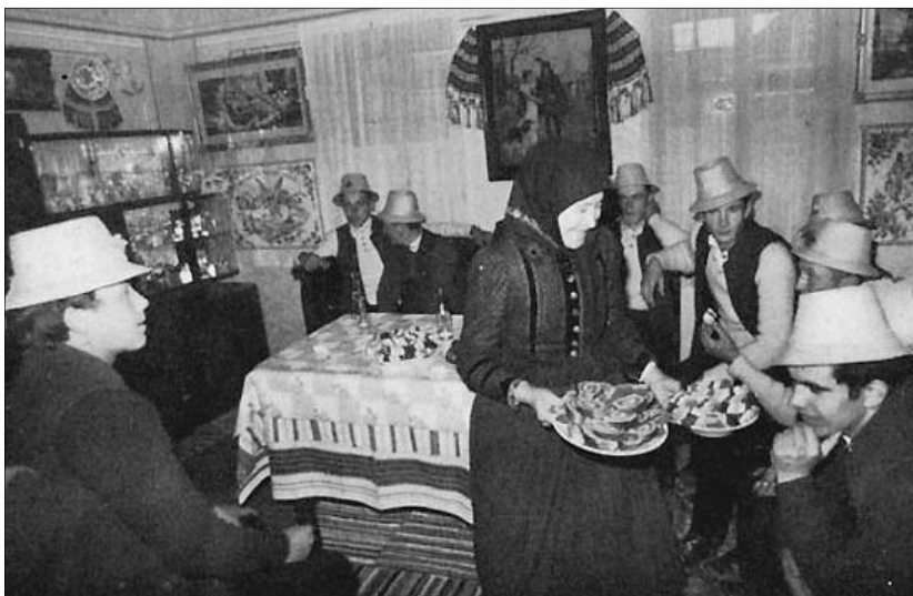
Süteménnyel kínálják az öntözőket