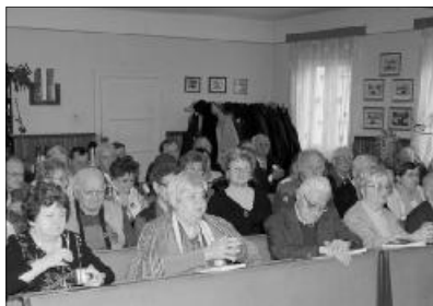
Jubileumi rendezvénysorozat zárult a nagykárolyi konferenciával