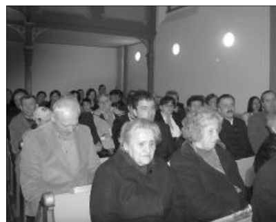
Megtelt a belényesi református templom