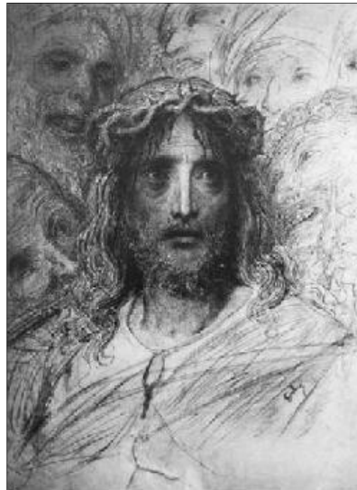
Gustave Doré: Jézus