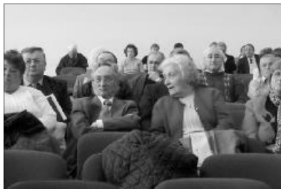
Augusztusban munkatársképzőre és konferenciára várják a presbitereket

Ugyancsak a főtitkár beszélt a 2010-ben megrendezett programokról, illetve az el-