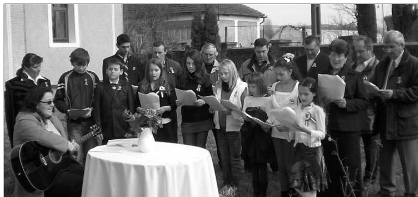
A magyarkakucsi „márciusi ifjak” kis serege ünnepi műsorral örvendeztette meg a gyülekezetet