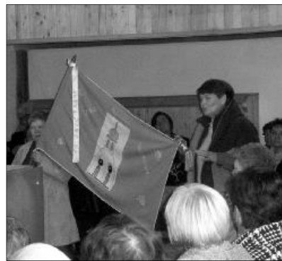
A nőszövetségi zászlók bemutatása

A rövid szünet alatt az egrespataki nőszövetség tagjai lelkesen kínálgatták szil-