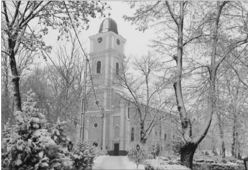
„Legyünk naponként megújuló új emberek, akik kérünk, keresünk és zörgetünk.” Érmihályfalva református temploma

Krisztus tanítványai tudják, hogy nem boldogulhatnak imádság nélkül. Azt is sejtik, hogy nem minden nevezhető fohásznak, ami e fogalom jegyében történik körülöttük, vagy éppen amit gyakorolnak ők is az ősi hagyományok nyomán.