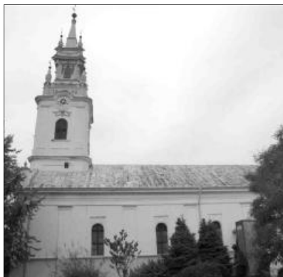
Sarkadi református templom

A konferencia kiemelkedő eseménye és programja volt Gulácsy Lajos nyugalmazott kárpátaljai püspök biznyságtétele. Lajos bácsi – kérte, hogy így szólítsuk – fiatalos, meggyőző erővel adott tudósítást hitvalló életéről és szolgálatáról. Beszámolt a kárpátaljai csodákról, arról a lelkületről, amely bosszantására volt a hatalomnak: nem volt lázadás, nem volt öngyilkosság a nehéz időkben, s ahonnan elhurcolták a lel-