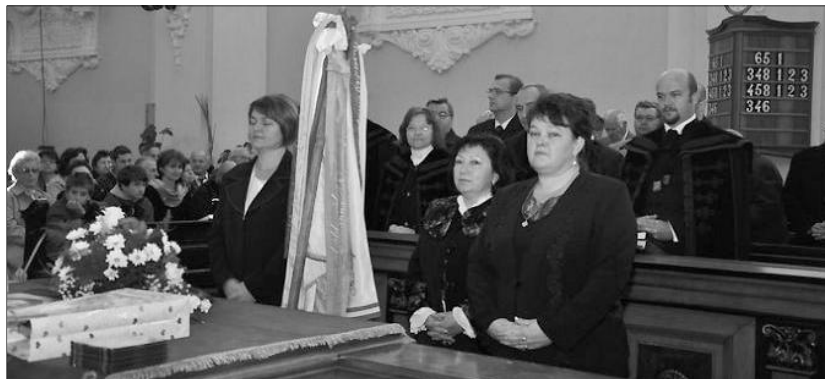
Az utódok elődeik áldásos tevékenységére is emlékeztek a nőszövetségi jubileumon

Az évforduló alkalmából hálaadó istentiszteletre indult a Lánchos templom gyülekezete. Harangszó buzdított, hívogatott ünnepelni, emlékezni, hálat adni, köszönettel leborulni.