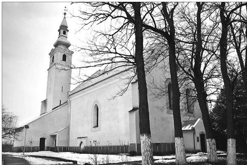
A szalárdi református templom

Az említett kutatások alapozták meg a szakszerű restaurálást, ami szerkezeti megerősítést, a fedélszék és az oromfalak rekonstrukcióját és külső-belső helyreállítást foglal