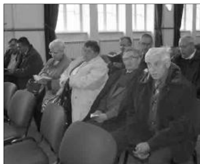
A szövetség márciusban tartja tíz éves jubileumi megemlékezését.

Döntöttek a 2012-es tagsági díjról, ami maradt a személyenkénti 10 lej, a magyar református vállalkozók szövetségének létrehozásáról, a RORPSZ megalakításáról, a felnőttképzés beindításáról, a pénztáros banki felhatalmazásáról. A szövetség 2012. március 19-én tartja tíz éves jubileumi megemlékezését.