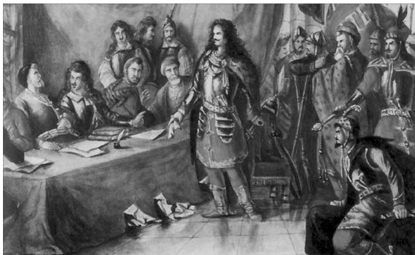
Rákóczi visszautasítja a Szatmári békét. Than Mór festménye

vallásszabadságot is a király kegyétől függően „ad hoc” (= egyelőre) engedélyezte. Az 1691. évi Explantio Leopoldina addig elképzelhetetlen megszorításokat alkalmazott a protestánsokkal szemben. Az 1701-ben kiadott rendelet a töröktől visszafoglalt területeken a protestáns vallás gyakorlatát megtiltotta. 1608 és 1647 között mintegy 300 protestáns templomot vettek el a katolikusok, 1647 és 1681 között újabb mintegy 900-at, és 1681