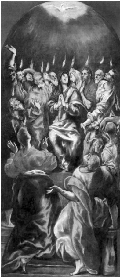
„Áldott Lélek, te légy mellettünk” (MRÉ 245). El Greco: Pünkösöd

ment ez olyan gyors ütemben, ahogy azt eltervezte, így szava hol igen volt, hol nem. Pál ebben és erről a helyzetről mondta, hogy az ember által megtervezett utak esetében előfordulhat az igen is és a nem is, ám Krisztus az Isten és az ember közötti úton mindig Isten Igenje marad. Krisztus az