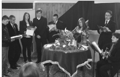
A fiatalok énekszámokkal örvendeztek Krisztus győzelmének