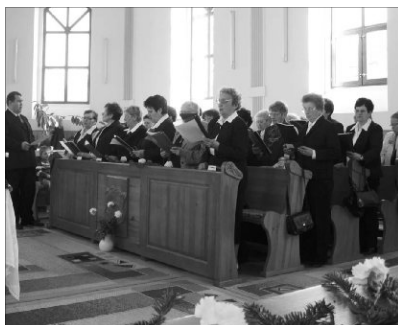
Az élesdi Hozsanna Nőszövetség énekszolgálatát