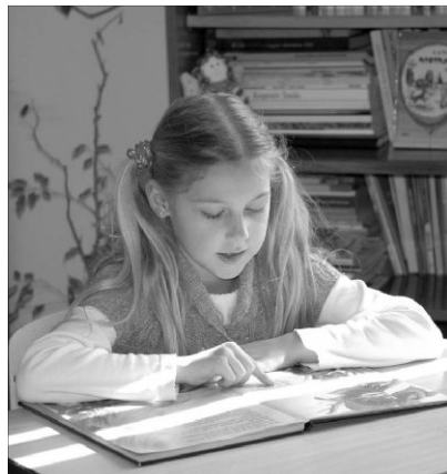
Jean-Paul Sartre: ők csak hömpölyögtek tovább, el nem engedtek volna egy vesszőt sem

Az idei verseny mottója Jean-Paul Sartre szavai voltak: „Egy pillanat múlva érttem: a könyv beszél. Áradtak belőle az ijesztő mondatok, mint megannyi százlábú, csak úgy nyüzsögtek a szótagok és betűk, nyújtogatták kettős magánhangzóikat, rezgettették a dupla mássalhangzókat, az orrhangokat, a zöngéseket, közben-közben szünetek és sóhajok; tele voltak ismeretlen szavakkal ezek a mondatok, megrészegettek önmaguktól, önnön tekervényeiktől, velem mit sem törődve; olykor eltűntek, még mielőtt megérthettem volna őket, máskor