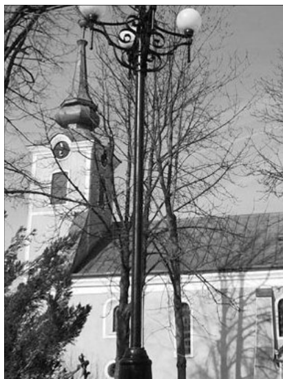
A hegyközsatári református templom

A megszokotthoz képest rendhagyó rekonstrukció nem jöhetett volna létre a kiterjedt kutatás és a korábbi helyreállítási elképzeléseket részben módosító tervváltozat iránti megértés, a gyülekezet elöljáróinak és főleg lelkesének hathatós támogatása nélkül.