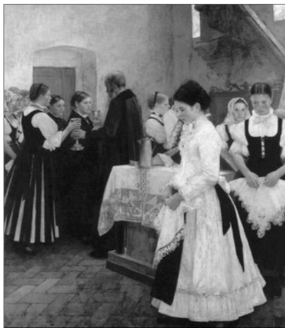
Csók István: „Ezt cselekedjétek az én emlékezetemre”, 1890