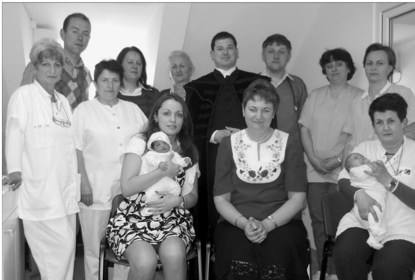
A kórházi alkalmak egyik felemelő pillanata, árva gyermek keresztelese az intézmény munkatársai körében

„És a hitből való imádság megtartja a beteget, és az Úr felsegíti őt. Valljátok meg bűneiteket egymásnak és imádkozzatok egymásért, hogy meggyógyuljatok.” Jak 5,15-16/b