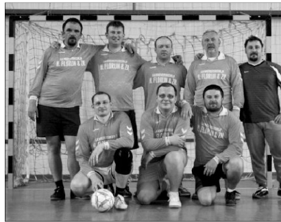
A lelkészfoci királyhágómelléki résztvevői

✿ LELKÉSZEK A FOCIPÁLYÁN – III. TEPSI KUPA NYÁRÁDSZEREDÁN. Április 19-20. között zajlott le, az immár hagyományosnak mondható TEPSI kupa (Testileg Eltunyult Papok Sport Imitációja), az erdélyi református lelképásztorok teremlabda-