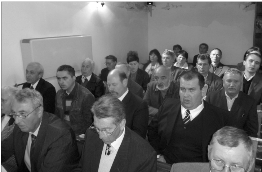
Tizenkét Sebes-Körös menti egyházközség presbiterei találkoztak Mezőtelkiben

A Mezőtelki Református Egyházközség adott otthont a tizenkét Sebes-Körös menti egyházközség presbiterei újabb találkozájának, április 22-én vasárnap délután. A találkozóknak évek óta hagyományuk van, az egyházközségek presbiterei, lelkipásztoraik vezetésével minden évben két alkalommal: tavasszal és ősszel találkoznak.