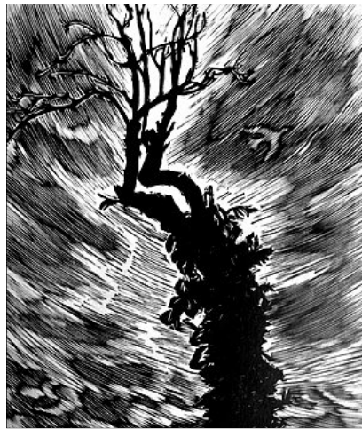
Gy. Szabó Béla: Petőfi körtefája Székelykeresztúron

Ügyelj magadra, ne válj ilyen keményszívűvé, ne meszesedjen el szíved, belső hallásod el ne tempuljon, el ne vesszen!