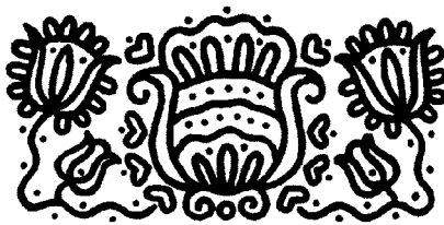
Radványi Károly grafikája

A magyar puritánok is úgy érezték, hogy ekkorra már felszínessé vált az egyhá-