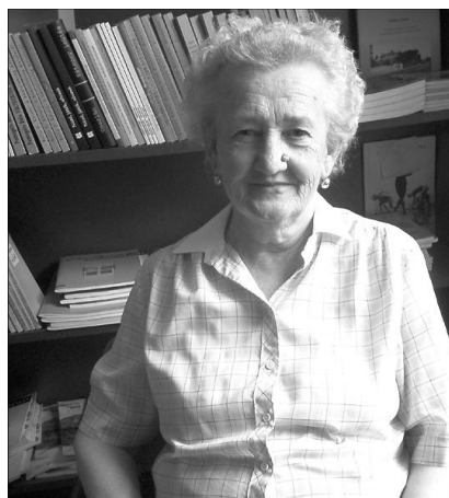
Terike néni aktív, tetterre kész, lelkiismeretes szolgálója volt egyházának

Istentiszteletek alkalmával a templom bejáratánál ült, hogy a sztopanaszai miatt friss levegőn lehessen. Így a ki- és bejövétel alkalmával egyaránt találkozhattunk vele. Jó szóval és mosollyal köszöntött és lelkiismeretesen gondos-