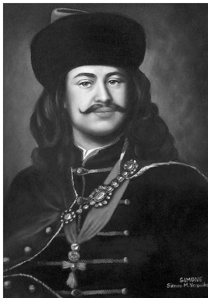
Az ingtag vallási békességnek egyetlen garanciája a fejedelem, II. Rákóczi Ferenc személye volt

léssel juttatta megegyezésre a vitákat. Ez is mutatja államférfiúi bölcsességét, de többet is mutat. Azt, hogy a fejedelem minden bizonnal becsülte a két protestáns hitfelekezetet, amelyeknek egyikéhez, a reformátushoz ősei is tartoztak. Maga a szabadságharc idején hazánkban létre jött vallási béke a különböző felekezetek kényszerű kiegyezéséből keletkezett és nem valamiféle mai ökumenikus megbékéléshez hasonló megfontolásból és érzésvilágból. Ennek az in-