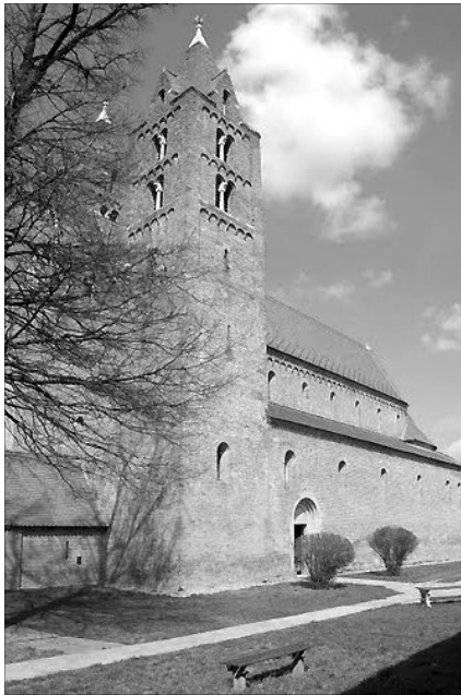
Ákos téglatemplomát a XII. század második felében kezdték építeni

Újabb építéstörténeti adalékként szolgált a templomtól északra 1999-2003-ban foly-