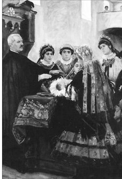
Csók István: Öcsényi keresztelő (1902)

Milyen nehéz keresztyénné lenni ebben a világban, amely a pénz bűvöletében él! Hiszen “minden baj gyökere a pénz szerelme” (1Tim 6,10). Az Egyház számára is mindig adva volt a veszély, a mában kell élnie, de nem a ma szelleme szerint. A feudális világban feudális, a polgári világban polgári volt a keresztyénség, ma, a konzum társadalomban, félő, hogy fogyasztói egyházzá válik az Egyház. Jézus tanította: „ahol a kincs, ott a szív” (Mt 6,21).