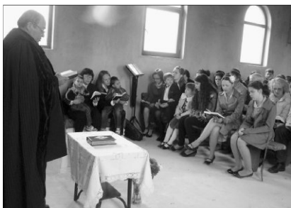
Először tartottak istentiszteletet az épülő templomban

✿ NÉMETSZENTPÉTER: ISTENTISZTELET AZ ÉPÜLŐ TEMPLOMBAN. „Eben-Háezer: Mindeddig megsegített minket az Úr!” Az 1Sám 7,12 volt az alapigéje a vasárnapi istentiszteletnek május 13-án, az épülő németszentpéteri templomban, Arad-Mosóc egyik szórványában. A majdnem 50 fős gyülekezet – gyermekek, fiatalok és idősebbek – hálás szívvel énekelték a 105. Zsoltárt, ki padon ülve, ki deszkákon, vagy tégladarabokon.