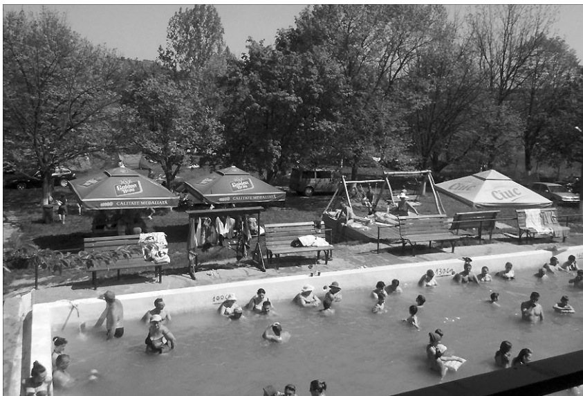
A fürdőt 1991 óta a helyi református egyházközség üzemelteti