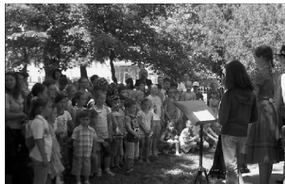
Mintegy 140 résztvevő találkozott a Diószegen tartott Barátság napján

Június 16-án diószegi kirándulással zárult a hajdúnánási önkormányzat által támogatott programsorozat, melynek keretében márciustól kezdődően a Hajdú-Bihar megyei kisváros pedagógusainak egy népes csoport-