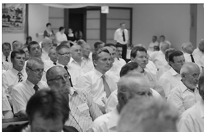
Dunántúli Egyházkerület 400 éves fennállása megünneplésében is osztozott a Konvent

✿ TÖREKEDNI AZ ÖSSZEFOGÁSRA - A GENERÁLIS KONVENT JÚNIUS 19-20-I ÜLÉSÉNEK ZÁRÓNYILATKOZATA. A Kárpát-medencei magyar református egyházak, egyházkerületek és egyházmegyéi tanácskozó testülete a Generális Konvent sorrendben hetedik ülését a Dunántúli Református Egyházkerület meghívására Szombathelyen tartotta 2012. június 19-én és 20-án. A tanácskozáson részt vettek a diaszpóra képviselőiben az amerikai és a nyugat-európai magyar reformátusok képviselői is.