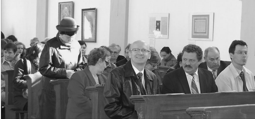
Ha jelen van az istentiszteleten a három-négy szlovák református közül valaki, akkor az igehirdetést szlovákul is elmondja a lelkész