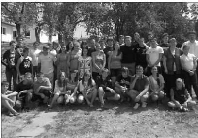
Jövőre is várják az ifjakat a Nagybányai Egyházmegye ifjúsági táborába