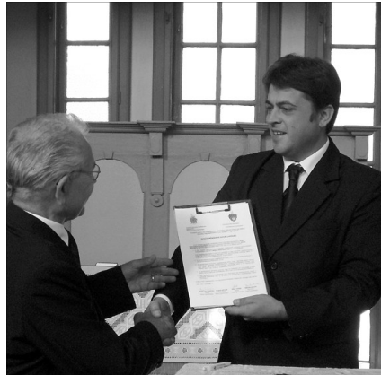
A presbiteri szövetségeket követően a két egyházmegye is együttműködési szerződést írt alá

Határmenti megyeként, az évek során sikerült jó kapcsolatot kiépíteni a szomszédos Békés megyei presbiter szövetséggel, ezt a kapcsolatot megpecsételtük 2008-ban, egy jól működő együttműködési szerződés-