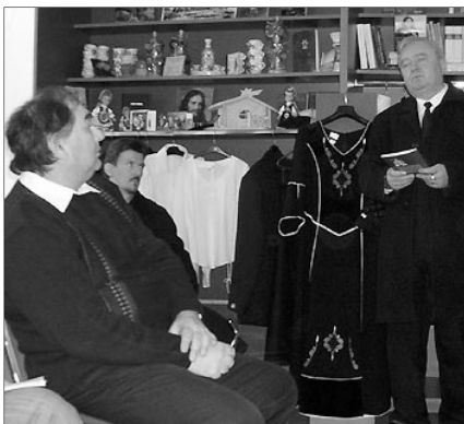
A könyvbemutató helyszínén megvásárolható a kötet