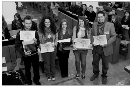
Magyarkéc csapata negyedszer győzött a kerületi szintű bibliaismereti vetélkedőn

✿ BIBLIAISMERETI VETÉLKEDŐ. November 19-én ötödik alkalommal került sor a Királyhágómelléki Egyházkerületi Bibliaismereti Vetélkedőre. Ebben az esztendőben a házigazda szerepét Jankafalva töltötte be.