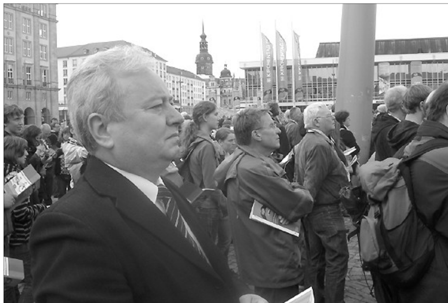
Csúry István püspök a 33. német evangélikus nagygyűlés tavalyi megnyitóján

– Pályázatokat koordinálunk több szinten is. Egyházkerületünk zöld utat adott több elkezdett fejlesztés folytatásához például: Rákóczy-kollégium, Hegyközszentmihályi gyógyfürdő, Degenfeld-kastély stb. Befejezéshez érkezik a Lorántffy Gimnázium épületének felújítása, folytatódik a Szatmárnémeti Református Gimnázium restaurálása. Az érminszenti Ady-központ megépítése is küszöbön van. Sződemeteren, Kőlcsey szülőfalujában tervezésre kerül az Isten, áldd meg a magyart-centrum. Tovább keressük az egyházi kórház építésének