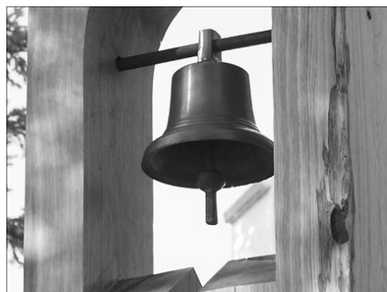
Az emlékoszlop szimbolikus eleme a több évtizedig szolgált iskolacsengő

A végvári iskolai jubileum jó alkalom volt arra, hogy a Romániai Magyar Peda-