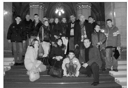
Az Országházba is ellátogattak a vérvölgyiek