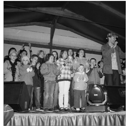
Kicsik és nagyobbak egyaránt felsorakoztak a kedvelt keresztyén énekes mellett