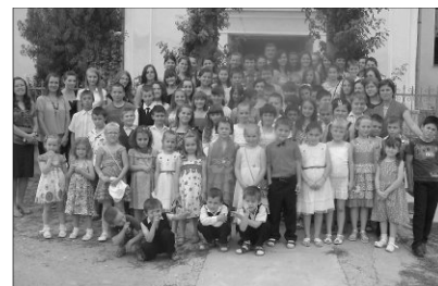
Apraja-nagyja Istennek adott hálát a hét áldásaiért

A gyermekek közötti munka segítségével sem volt hiány. A gyülekezet ifjúságával már a nyári vakáció beköszöntével elkezdtük a készülődést a szemléltető képek elkészítésében, az aranymondá-