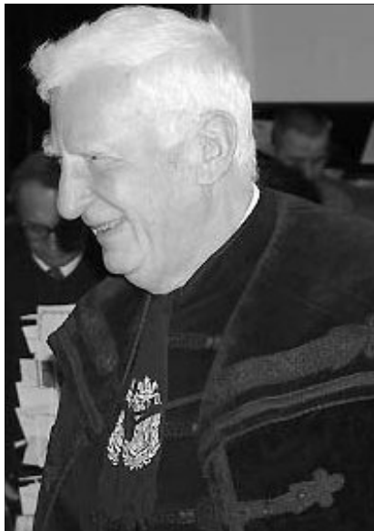
Mindig átélt üzenetet mondott. Sosem akart más lenni, mint igehirdető

Ez az életpálya – mint korábban mondtam –, minden vonásában jellegzetes, a szomorú és rettenetes 20. század fényében, majd-hogynem átlagos. Csiha Kálmán azonban messze kiemelkedik kortársai közül, és nemcsak az általa elvégzett egyházszervezői és egyházkormányzó munká révén. Természetes feladatának tartotta, hogy minden szolgálati állomásán szervezze és elevenítse a kisebbben élő magyar református gyülekezeteket.