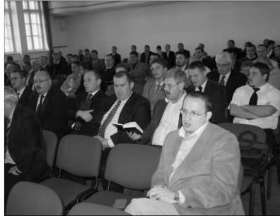
Időszerű egyházi közéleti kérdésekről is szó esett

A gyantai mézszárlás áldozatainak nevét és életkorát a Gyantáról elszármazott Borostestvérek olvasták fel, miközben a templom harangjai is megszólaltak.