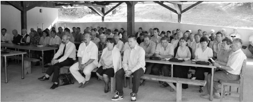
Önvizsgálatra indító kérdések hangzottak el

„Ha az ember Sólyomkővárra jön, mindig jól érzi magát” – mondta egy presbitertárs, amikor szeptember 1-jén a Szilágysomlyói Egyházmegye táborhelyén gyülekeztünk, a nyolcadik alkalommal megrendezésre kerülő presbiteri konferencián.