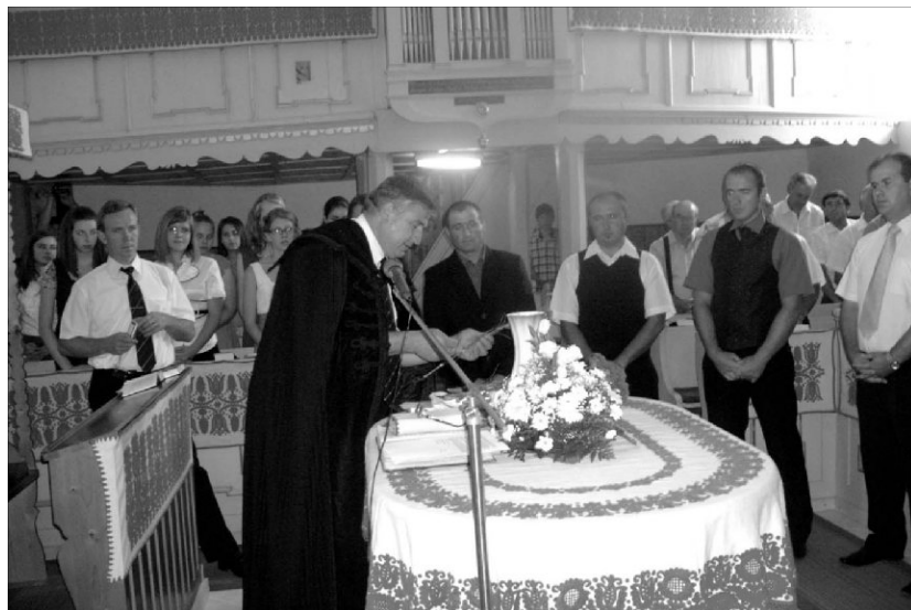
Megerősített fogadalomtétele. Konfirmációi találkozó Szilágyballán

Arra a kérdésre, hogy „mi a konfirmáció?” szinte gépiesen adják a választ azok, akik legalább már az első éves konfirmációi előkészítón részt vettek: „A konfirmáció az az istentisztelet, amelyen megfogadjuk, hogy Jézus Krisztusnak igaz követői és a református anyaszentegyház hűséges tagjai leszünk. Ekkor nyerjük el a felhatalmazást az úrvacsora vételére.” Ajkunkról a válasz igazán akkor válik tetszővé Istennek, ha az szívből jön, és a szavakat tett is követi. Ezzel szemben nagyon sokszor azt látjuk, hogy az évek teltevel azok, akik már megkonfirmáltak, Krisztus helyett a világot követik, a gyülekezet életében alig, vagy egyáltalán nem vesznek részt, és nem élnek az úrvacsorával.