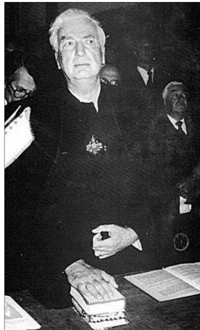
Püspöki eskütétel 1990-ben

Titka és népszerűsége azonban nemcsak abban rejlett, hogy mindig átélte üzenetét mondott, hanem abban is, hogy sosem akart más lenni, mint igehirdető. Üzenete minden esetben a konkrét hallgatóságához szólt, abban a konkrét helyzetben, melyben őket látta. Egyszerre volt pap és próféta. Mint pap, népe sorsát hordozta, mint próféta, népe jövőjét kereste. A 2004. decemberében tartott tragikus kimenetelű népsza-