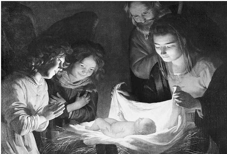
Gerrit van Honthorst: A gyermek imádása, 1620

Mesélő: Különleges nap van, karácsony, a szeretet ünnepe. Több mint 2000 esztendővel ezelőtt egy kis városban csodálatos esemény történt. Egy kisgyermek született. Minden születés csoda, de ennek a gyermeknek az érkezése igazán különleges volt. Csak nagyon kevesen vették észre, hogy Isten szállt a földre. Leszállt, mert az emberiség elfordult tőle. Leszállt, hogy akik igazán keresik Őt, meg is találhassák. Megjelent az igazi szeretet. Azóta eltelték évszázadok, évezredek. Vajon milyen a mai karácsonyunk? Isten szeretetét ünnepeljük, vagy emberi szokásokat követünk? Ismerkedjünk meg egy mai családdal: apa, anya, gyermek. Lássuk, milyen az ő karácsonyuk.