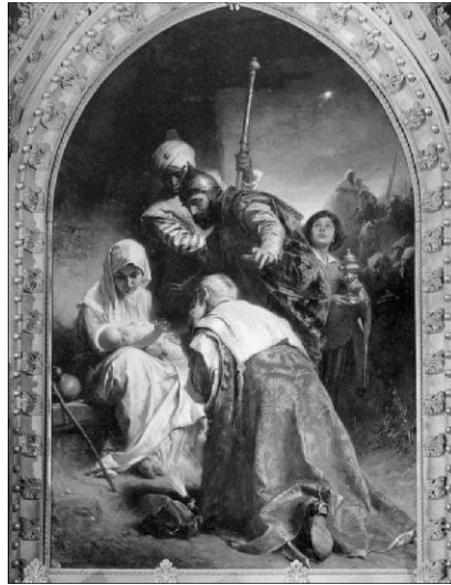
Benczúr Gyula: Napkeleti bölcsek, 1911

1950 karácsonyát mutatott a naptár, amikor tizenhat és fél évesen először mehettem legációba, azaz akkor lehettem a Debreceni Református Kollégium ünnepkövete Bárádon. A legáció a református és unitárius főiskolák, sőt egyes középisko-