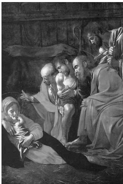
Caravaggio: Jézus imádása, 1609

Szomorú volt a világ odáig, míg örömet nem hozott a Kisjézus. Fekete volt a háztető, és az utca, és a kert, és a szántó föld. Megfagyott a testük, és fájt nekik, mint a seb, könnyeztek tőle, könnyük csordult az ereszen. Szegény föld, hogy fázott, szegény fák, hogy reszkettek, dideregtek, szegény világ beteg volt, szomorú volt, siralmas volt. Hanem mikor eljött a Kisjézus, hó hullott az égből, fehér bundát borított a kertre és a rétre és a szántóföldre és a háztetőre. Vidám, pajkos hópelyhekből rakott dunnát, amely csillog a napon, szikrázik a sugáron, repül a szélben. Ablakunk alatt virágos kert volt, azon túl vadrózsabokrok, azon túl orgonacszerjék, azon túl fák, akác fák, hárs fák, jege nyefák. Még a múlt héten milyen sötétek voltak. A virágjaim, szegénykéék lefagytak,