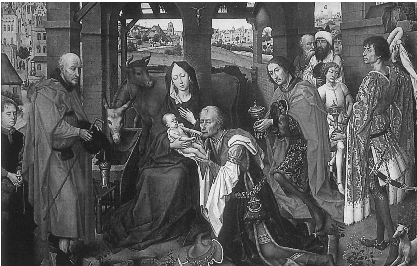
Rogier van der Weyden: A napkeleti bölcsek (részlet)