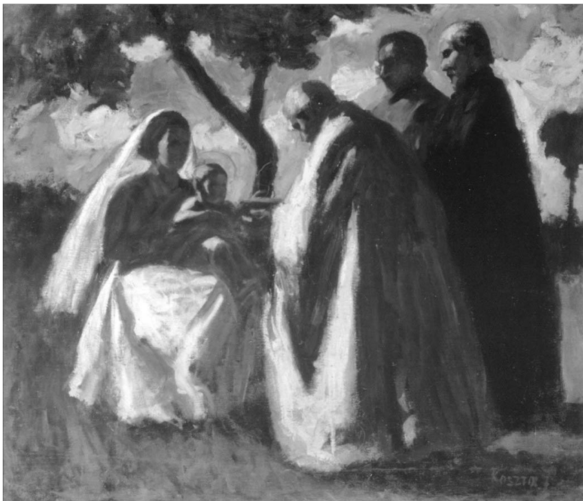
Koszta József: Háromkirályok, 1906-1907