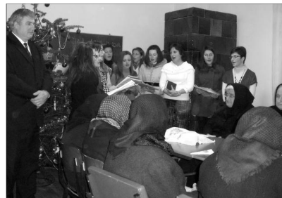
Az ifjak verses, zenés műsora

Jézus arra tanít minket, hogy úgy szeressük egymást, mint ahogy Ő szeretett minket. De ne csak szavakkal szeressünk,