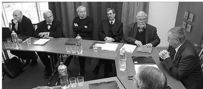
A Generális Konvent június 19–20-án, Szombathelyen tartja plenáris ülését, a Dunántúli Egyházkerület szervezésében, ahol a kerületet megalakító körmendi zsinatról is megemlékeznek