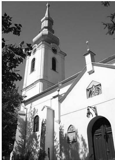
A székelyhídi templom. Jelentős maradványai kerültek napvilágra a korábbi épületrészeknek

A részleges feltárás nyomán a Kárpát-medence egyik legértékesebb és viszonylag jó állapotban konzerválódott falképegyüttes-