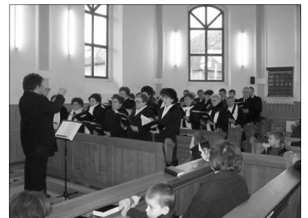
A székellyhídi gyülekezet kórusa Élesden