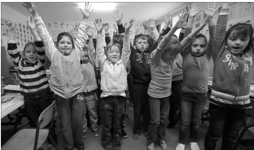
Zilahi általános iskolások

lyik még nem kapta vissza az épületét. Az 1948-ban államosított, majd 1991-ben újra-indított kollégium célja az évszázados hagyományok folytatása, amelyeket a református oktatás-nevelés a XVI. századtól kezdődően kialakított Erdélyben. Pótolni szeretnék azt a hiányt, amit az elmúlt évtizedek okoztak a református nevelés területén.