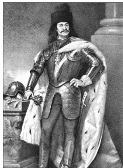
II. Rákóczi Ferenc

Rákóczi és felsővadász II. Rákóczi Ferenc, 1697-től birodalmi herceg Borsiban született 1676-ban és a törökországi Rodostóban hunyt el 1735-ben. I. Ferenc választott erdélyi fejedelem és gr. Zrínyi Ilona fia. Néhány hónapos volt, amikor elvesztette apját. Katolikusnak született és nevelték, amire nagyanyja, Báthori Zsófia különös gondnal ügyelt. 1681-től Thököly Imre volt