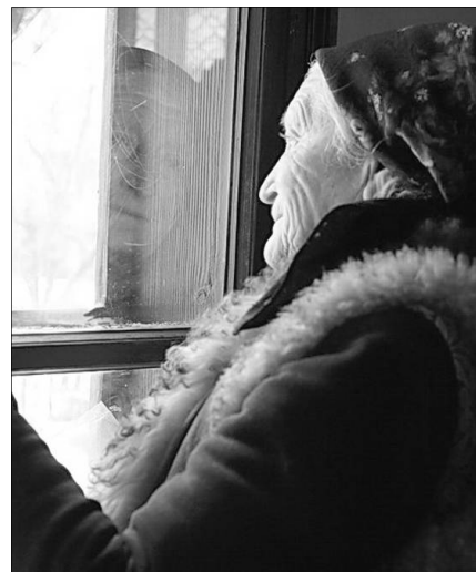
Fekete Réka: Várakozás (II.)

Mire feltápáskodott, már a tornácra verte valaki lábáról a havat. Kopogott és nyikorogva magától megnyílt az ajtó. Mint ha a fia állt volna előtte, úgy húszéves korában. Széles válla, szálas termete eltakarta az ajtót. Csak nézte-nézte megtorpanva, kezét remegő ajkára szorítva.