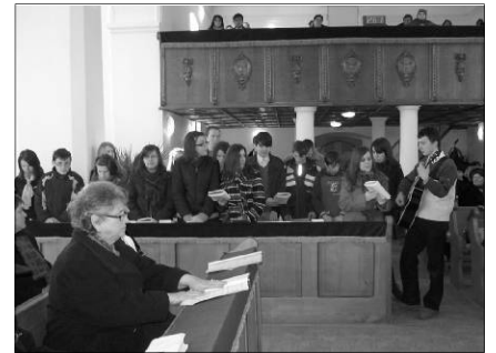
Az ifjak szolgálata a margittai imahéten