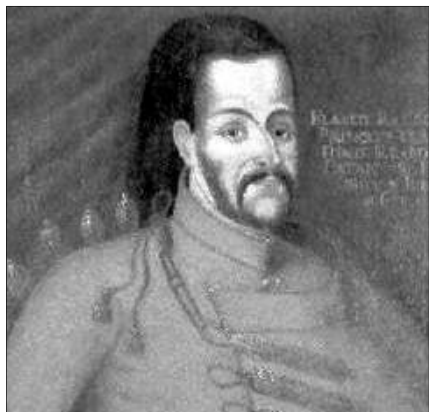
I. Rákóczi Ferenc

1566 és 1582 között öt román református püspöke volt az erdélyi román református egyháznak. A reformáció szellemében ez az egyház román szertartási nyelvű egyház volt és lelkészei románul prédikáltak az Isten igéjét. Első románra fordított egyházi irataik még a XVI. században jelentek nyomtatásban. Ezek a világon az első románul nyomtatott könyvek. A magyar református egyházhoz hasonlóan ebben az egyházban is megindult az anyanyelvi iskolázás, hogy a hívek tudják olvasni az egyházi irodalmat. Tehát félreértések elkerülése végett, ennek a református egyháznak nem volt célja a magyarosítás, sőt a román anyanyelvi iskolázást és könyvkiadást is ez hozta létre Erdélyben. Egyházilag pedig a román ortodox egyház akkori ósláv liturgiai nyelve helyett, amiből a román nép egy szót sem értett, románul folyt az istentisztelet.