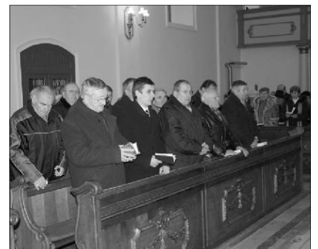
Imaheti alkalom Szatmár-Németiben