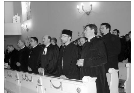
A történelmi egyházak képviselői Várad-Olasziban