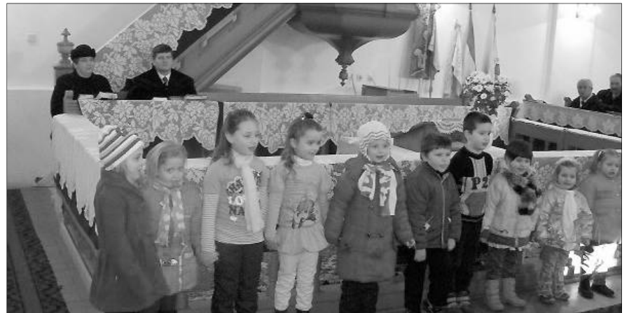
Gyermekek műsora az érmihályfalvai imahéten. A nyitónapon Rákosi Jenő érmelléki esperes hirdett igét

Január 29. és február 5. között a kettős évforduló jegyében szervezte meg a Presbitérium az imahétet. A reformátusság meghívta a helyi római katolikus, görög katolikus, ortodox gyülekezeteket (a baptisták