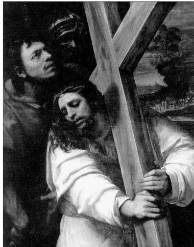
Sebastiano del Piombo: Krisztus a Kálváriára

Tavaszi van, tavaszi szelek fújnak. A Szentlélek ereje által lesz benned tapintat, szeretet, türelem békülni és békíteni, Istennel és egymással. Húsvét a békesség ünnepe, legnagyobb ünnepünk.