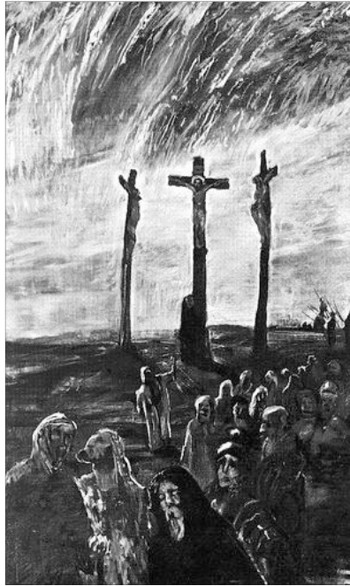
Gulácsy Lajos: Golgota (1912)

– Még sohasem láttam ilyesmit. Nem is tudom, mért mentem el. Tulajdonképpen nem is oda készültem, csak elsodort a tömeg. Iszonyú lehetett így szétfeszítve belefagyni a halálba. És a csöcselék hogy üvöltött. Némelyik majd esztét vesztette, úgy átkozódott. Jézust pedig csúfolták és köpdösték, míg egy százados szét nem vágott közöttük. Azt mondták, kapernaumi. A legjobban Jézus bírta. A másik kettő már félholt volt, ő még mindig az átkozókat nézte. És hogy nézett. – Saulnak elcsuklott a hangja. Kezével halántékához kapott, mintha az emlékek tüzes abroncsai szorítanák, aztán rekedten bugyborékoltt belőle tovább a hang: – Úgy nézett, mintha nem is ő