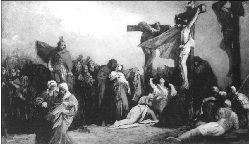
Székely Bertalan: Golgota

Nagypéntek és húsvét történései mindnyájunkat eligazítanak a halál és élet kérdésében. Sok tévhit, megannyi félelem és reménytelenség szerte foszlik, ha komolyan vesszük Urunk szavait: „Bizony, bizony mondom néktek, hogy aki az én beszédeimet hallja, és hisz annak, aki engem elbocsátott, örök élete van, és nem megy a kárhozatra, hanem átlament a halálból az életre.” (Jn 5,24)