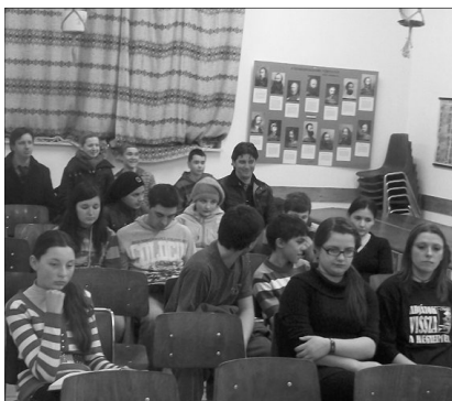
Koltó, a Wass Albert szellemi örökségét népszerűsítő öt erdélyi helyszín egyike volt