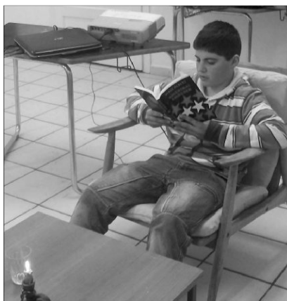
„Krisztus az alap, melyen megállhatunk és a szeretet a lánc, mely összeköt minden emberrel a földön”

József, Tamási Aron és a többi nagy szellemóriásunk által kinyilvánított értékeket.