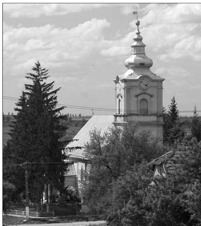
A dobrai református templom.

Kallós Anna Mónika ezenkívül több értékes és érdekes tanulmánnyal szerepel a kötetben. Dobra mai élő helynévrendszere című dolgozatából megtudhatjuk, hogy a