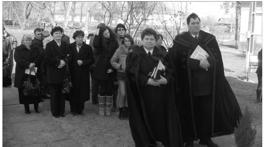
Az ünnepség koszorúzással folytatódott