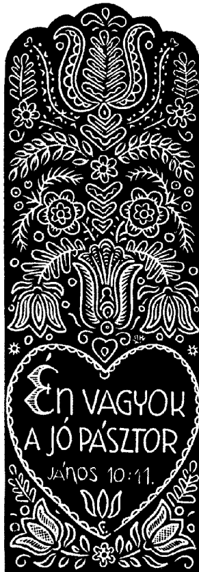
Radványi Károly alkotása

Mindez óvjon meg két kísértéstől. Egyfelől attól, hogy többet kívánjunk a látható egyháztól, mint amennyit Isten igéje szerint kívánhatunk. Ne akarjuk a tökéletességre jutott egyháznak minden jellemvonását már itt a földön szemlélni, s ha nem találjuk meg ezeket, ne akarjunk új földi szervezeteket létesíteni és így