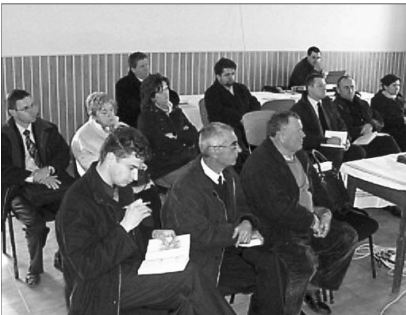
A lelkészértekezlet résztvevői

✿ NAGYVÁRADON IS BEMUTATTÁK TÖKÉS ISTVÁN PRÉDIKÁCIÓS KÖTETÉT. A Sulyok István Teológiai Tudományok Intézete (SITTI) szervezésében március 11-én Nagyváradon is bemutatták Tőkés István nyugalmazott teológiai professzor IGE-hirdetés című, predikációkat tartalmazó kötetét. A Nagyvárad-Olaszi református templomban a kötet 96 éves szerzője hirdetett igét. Tőkés István a Mt 11,28-30 alapján arra mutatott rá, hogy Jézus Krisztus megnyugvást hoz mindazok életébe, akik belefáradtak a mindennapok terheinek cipelésébe, és a fáradtság, megterheltség, kilátástalanság nyomorító súlyától szenvednek. A Megváltó nem veszi le a terheket a vállunkról, hanem erőt ad a folyta-