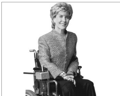
Joni Eareckson Tada könyvei magyarul is olvashatók

A kérdésre, hogy mit mondjunk a szenvedő embernek, Tada így válaszol: „Fontos,