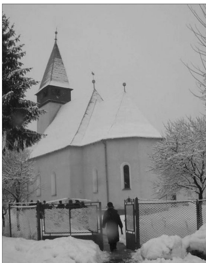
Hosszúmező templomának középkori eredetéről inkább csak arányai tanúskodnak

Misztótfalunak a Szatmár-nagybányai műút sávjai által közrefogott, kőkerítéssel is körülvett református temploma viszonylag híven őrzi XV. századi állapotát: gazdagon profilozott csúcsíves nyugati kapuja, ülőfülkéje, szemöldökgyámos sekrestyekapuja és tabernákulumfülkéjének sajátos kialakítású kerete gótikus faragványok, ablakainak mérműit azonban kiszedték, szentélyének boltozatát lebontották. Héjazata és alacsony hajlásszögű, aluméretezett fedélszéke is cserére szorul, ezért a közeljövőben felújítását tervezik. Torna 1893-ban épült hozzá.