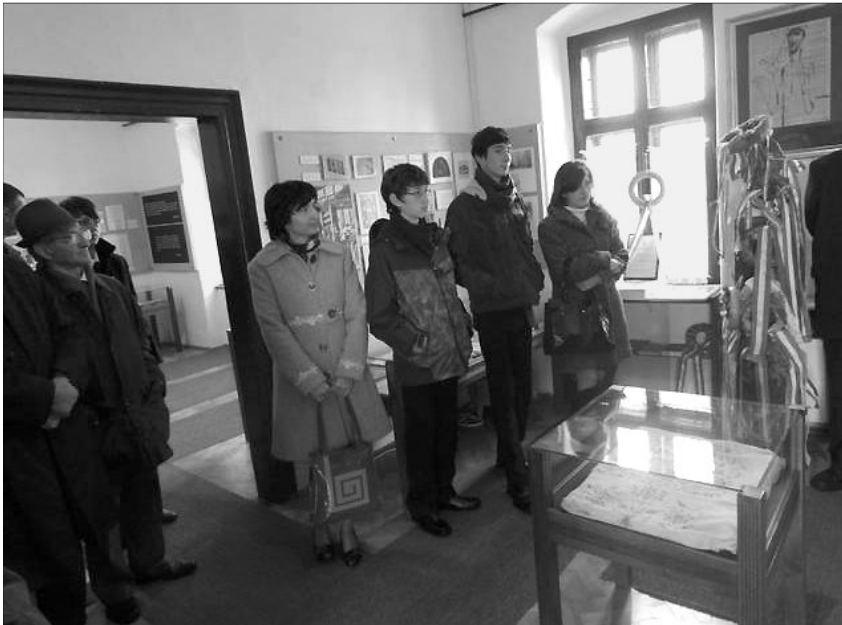
A Misztótfalusi Kis Miklós életét, munkásságát bemutató gyűjteményes ház sok látogatót vonz

Emlékezni hívogatta a híveket a misztótfalusi református templom harangja, október 13-14-én. Két nevezetes eseményre: egyházmegyei presbiteri konferenciára és nőszövetségi jubileumi évfordulóra került sor.