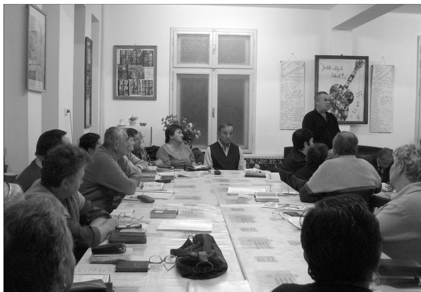
Tisztázzuk dolgainkat Istennel. Archiv felvétel

dés, a lélek betegsége gyakran okozhat testi megbetegedést. Ezért kell tisztázni dolgainkat Istennel, becsületesen megvallani bűneinket. Válaszul Istentől erőt kapunk a mindennapi élethez, munkánk elvégzéséhez. A tönkrement életű emberek olyan lelkiállapotban vannak, ahol Isten Igéje meghallgatásra talál, a kudarcok sok esetben odavezetik őket.