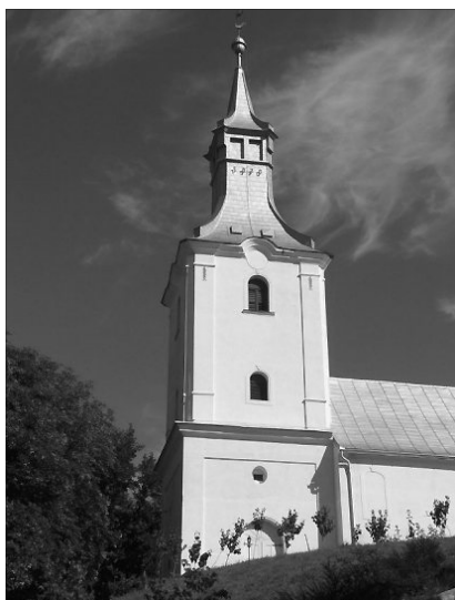
Ipp temploma két XVII. századi, a Bideskúti család tagjainak emléket állító sírkövet is őríz

Kisebb méretű késő gótikus református templom áll Szamosardó fölött egy dombtetőn. Hajóját és a nyolcszög felével záródó, két boltszakasznyi hosszúságú szentélyét kéttagú támpillérek erősítik, a hajónál aszimmetrikus elrendezésben. A szentély északi oldalához az egykori sekrestye helyére 1958-ban harangtornyot építettek. A deszkamennyezetes templom ablakaiból hiányoznak a mérművek. Nyugati kapuja félköríves, a sekrestyekapu pedig szemöldökgyámos, mindkettő csavart kanellúrájú lábazatról induló, hengertagos bélletű. Diadalívét utólag alakíthatták félkörívesé, konzoljai fölött az egykori diadalívkereszt fészkei láthatók. Az egyik déli saroktámpillér vízvető fölötti kváderén fekvő helyzetű Drágffy-címer található, valószínűleg