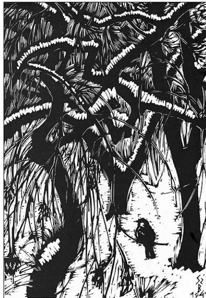
Gy. Szabó Béla alkotása

Gondold át a jézusi mérték szerint helyed és szereped környezetekben, családotokban, gyülekezetekben, hazádban. Akármennyire nehéz, szokatlan, egyedi, te a szolgálat útját válaszd és vállald, ne az elnyomását!