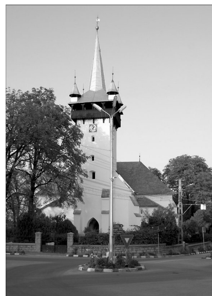
A krasznai templom korábban a provinciális gótikát példázta