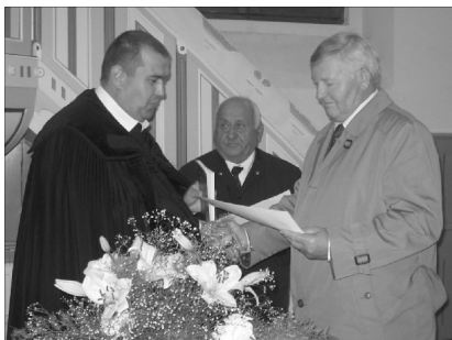
Tiszteletbeli presbitereket is avattak

✿ KONFERENCIA ÉS SZAKMAI NAP A REFORMÁCIÓ JEGYÉBEN. Október 27-én, Nagyváradon került sor az őszi kántorkonferenciára, melyre egy partiumi és két magyarországi előadót hívtak meg. A reformáció jegyében szervezett szakmai értekezés reggeli áhítattal vette kezdetét, majd ifj. Geréb Miklós lelképásztor A genfi zsolttárok évszázadai címmel tartott előadást. A genfi zsolttárok megjelenésének 450. évfordulóján a zsolttárok népszerűségéről, dallam és szöveg kapcsolatáról, néhány zsolttár mai feldolgozásáról is szó esett. Ezeknek biblikus tartalma, imádságos és hitvalló jellege a reformáció kezdetétől meghatározza a protestáns egyházak lelkületét. A zene a reformáció szívverése volt, Kálvin számára