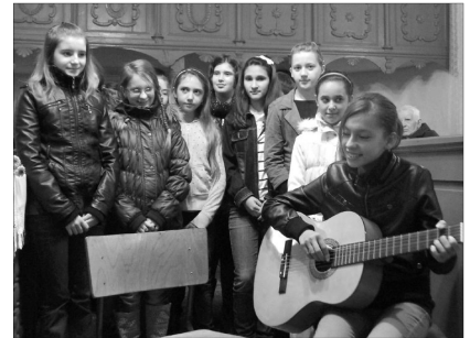
A gyermekek is köszöntötték az időseket

Az istentisztelet alapigéjével szolgáló 71. Zsoltár 14-21. versei elsősorban az idősök áldásaira hívták fel a gyülekezet figyelmét, hangsúlyozva azt, hogy az öregkor – a maga gyengeségeivel és bajaival együtt – az