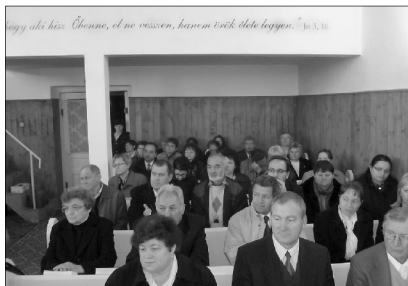
Megjelenés előtt áll a közös presbiterképzési program

Alulírott, mint a Presbiteri Szövetség ügyvezető elnöke, egyházmegei PSZ-jegyző, felszólalásában rámutatott arra, hogy a presbiteriség nem pusztán tisztség, egyházi rang, hanem felelősségteljes szolgálat, amelynek forrása az elhivatottság, a belső és külső elhívás. A KREK PSZ elnöksége évek óta szorgalmazza egy közös presbiterképzési program kidolgozását, amely remélhetőleg hamarosan megjelenik.