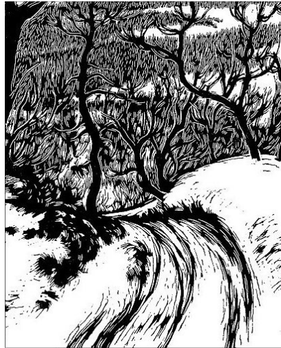
Gy. Szabó Béla alkotása

Aki elhajol, elpártol a Krisztusról szóló evangéliumtól, az Istentől hajol el, Istentől pártol el. Pál ezt nem akarja, ezért beszél és tanít harciasan. Világosan fogalmaz, aki a kijelentett evangéliumtól elpártol, az átok alatt legyen.