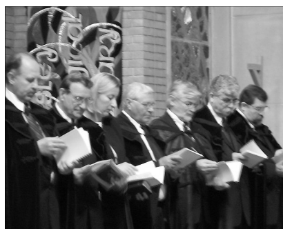
Az amerikai magyar református egyház esperesei és lelkipásztorai

ragaszkodtak a lelkiségükhöz valamint az élő egyházi és népi hagyományaikhoz a templomépítő, egyházalapító atyák és anyák. Nem is volt még egy olyan etnikai közösség, mely olyan rövid idő alatt annyi templomot épített, mint a magyarok. Komolyan vették a vasárnapot, szerettek énekelni, imádkozni és a sákramentumokkal élni. Áldoztak a templomaik és gyülekezeteik fenntartására, bár szükség volt a központi egyház missziói segélyeire is. Főleg a nagy gazdasági világválság és a háború idején sok lelkipásztor a fizetését is alig tudta biztosítani. A mostoha körülmények ellenére folyt a gyülekezetépítés, a konfirmáció, a magyar iskolák, a jótékonyági vacsorák a kulturális műsorokkal.