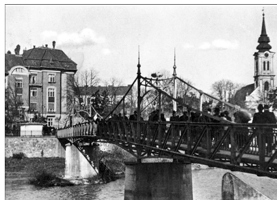
Az egykori Garasos hid mögött a várad-olaszi református templom