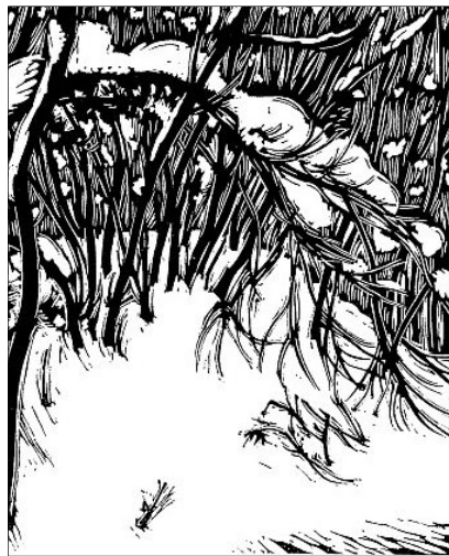
Gy. Szabó Béla alkotása

Pál és tanítása ellen zsidó tévtanítók kampányoltak. Azt tanították, hogy csak azok üdvözülnek, akik körülmetélik magukat, akik betartják a zsidó szertartásokat és szokásokat is. Pál e tévtanítók és tévtanítás ellen beszélt, ebben a levelében a hamis tanítás ellenében hangsúlyozza az igazságot.