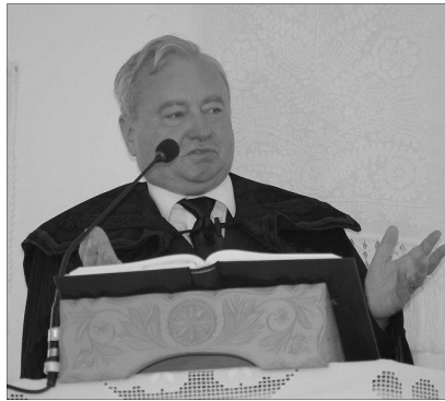
„Az igehirdetés az ismert Istent hozza közel”

Gimnáziumot, ami ugyancsak egy uniós projektből származott, a váradi polgármesteri hivatallal együttműködve. De így örülök a szatmárnémeti Kölcsey Gimnázium felújításának, az esperesi hivatal berendezésének. Nagy gondunk marad, ami hiányként jelentkezik, a zilahi Wesselényi Gimnázium sorsa. De Isten mindig akkor mutatja meg a legjobban hatalmát, amikor teher alatt voltunk. Biztos, hogy sok félelemgerjesztő elem van, sokan vannak, akik félelmet akarnak gerjeszteni, de ez szerintem arra kell az Istenben hívő embernek, hogy még több erőt gyűjtsön, hiszen ígéretünk