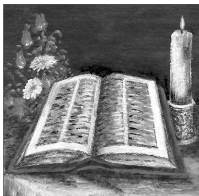
Március 3-a bibliavasárnap, adakozzunk az iratmisszió javára

Pál apostol hangsúlyozza, hogy az Úr vacsorájában részesülni csak méltón lehet. Aki méltatlanul eszik és iszik az úrvacsorában, az magára vonja Isten ítéletét. Az ember te-