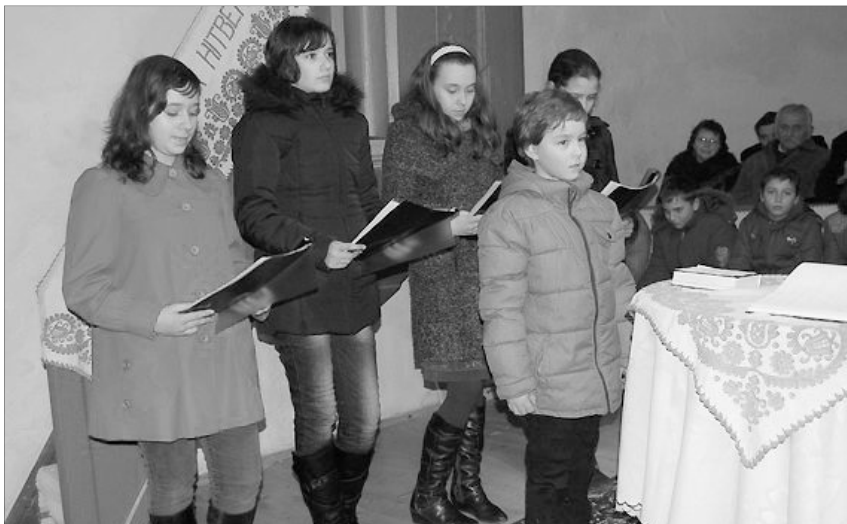
Nyelvében él... Királyhágómelléki emlékezés Kölcsey szülőfalujában

Kölcsey Ferenc 1823. január 22-én fejezte be a Himnusz megírását, Szatmárcsekén. Ennek emlékére, 1989-től e napon ünnepli a Kárpát-medence magyarsága a Magyar Kultúra Napját. Nem piros betűs ünnep, de sokak számára mégis egyet jelent a magyar nemzet szellemi nagyságával.