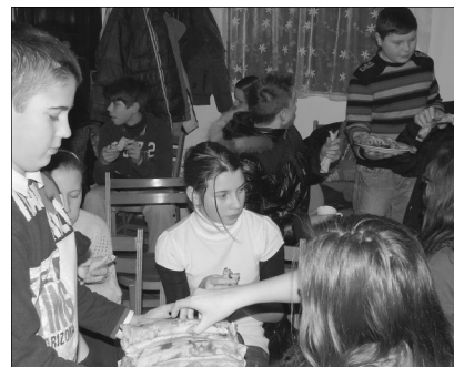
Közös istenkeresés Igével, játékkal, szeretetvendégséggel

A bibliaóra után közös imával zártuk az alkalmat, majd a lányok felszolgálták a szendvicseket, a forró teát és az izletes palacsintát.