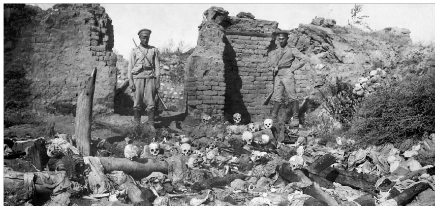
KORABELI FÉNYKÉP AZ ÖRMÉNY ÁLDOZATOK MARADVÁNYAIRÓL TÖRÖKORSZÁGBAN