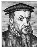
JOHANN JAKOB GRYNAEUS (1540–1617)

475 éve, 1540. okt. 1-én szül. Johann Jakob Grynaeus (Gryner) svájci humanista