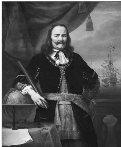
RUYTER MIHÁLY (1607-1676)

Hollandia fénykorának nemzeti hőse, akinek az élete példázta: Isten minket azért teremtett és helyezett ebbe a világba, hogy bennünk megdicsőíttessék.