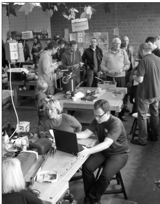
REPAIR CAFE HOLLANDIÁBAN

Ugyanakkor a használtruha, vagy általában használt árucikkek vásárlása nem feltétlenül szegénységi bizonyítvány, illetve nem szé-