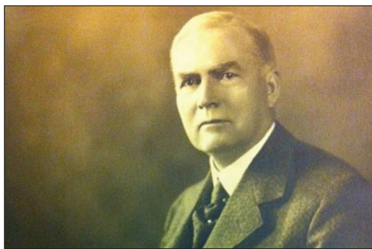
A NOBEL-BÉKEDÍJAS (1946) JOHN MOTT

Sajátos módokon merültek fel az egyházfegyelmi kérdések is: Dél-Afrikában például elemi kérdés volt, hogy megkeresztelhetők-e a többnejű férfiak? Az általános vélekedés az volt, hogy addig maradjon katekumenus, amíg egyet kiválasztva le nem mond a többi feleségről.