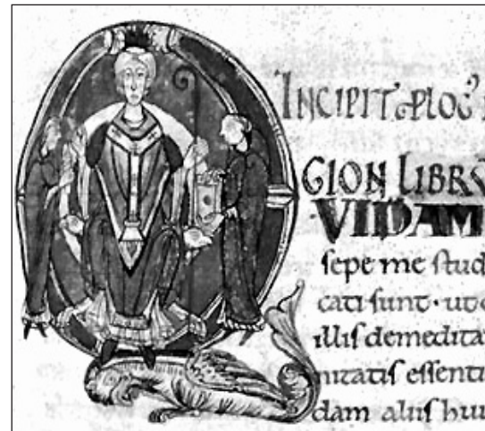
CANTERBURY ANSELMUS KÉPE EGY KÖZÉPKORI KÓDEXBEN

A római jog kiteljesedése Kr. u. 212 után következett, amikor Antonius Caracalla (188-217) császár a birodalom összes szabad születésű lakosának római polgárjogot adományozott. Igaz, hogy ennek hátterében az örökösödési illeték mint bevételi forrás szerepelt, de ettől kezdve mindenkinek a római joghoz kellett igazodni. Addig ugyanis mindig a helyi szokásjog volt érvényben, a római jogot pedig csak a joghézagok miatti tanácsstalanság esetén vették igénybe.