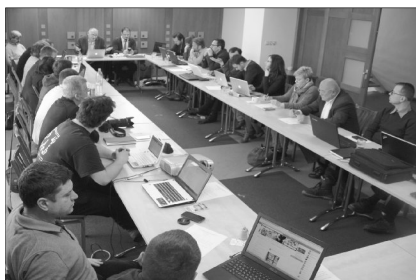
A KÁRPÁT-MEDENCEI REFORMÁTUS SAJTÓ MUNKATÁRSAI TANÁCSKOZNAK BEREKFÜRDŐN

Feliratkozás: harangszo-hirlevel+subscribe@googlegroups.com