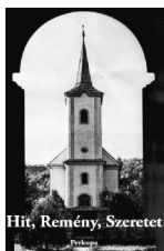
Hitt, Remény, Szeretet Pálffy

125 éve, 1891. ápr. 26-án hunyt el Vajányi Lajos ref. lp. Nemzetőr hadnagy az 1848/49-es szabadságharcban; szadellői (1852), körtvélyesi slp.; apját követve perkupai-varbóci lp. (1854-91); tornai esperes (1884-91). Méhészettel, szőlészettel és orvoslással is foglalkozott: lelkészársai körében méhészegyletet szervez; a filoxéra pusztítás után amerikai szőlőfajták ültetésére sarkall; az 1872-es kolerajárványkor segít a gyógyításban. Kazincbarcikán nevét viseli a Bajtársi Egyesület.