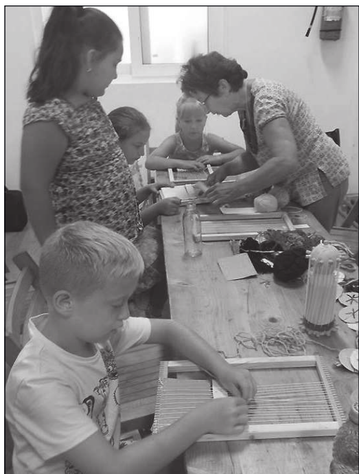
A szövés tudománya.

Az egész heti tevékenységre péntek délután egy összegző kiállítás tesz pontot, ahol a szülők, nagyszülők is számba vehetik gyermekeik, unokáik alkotásait és ki-ki hazaviheti azokat, emlék gyanánt. Meg egyfajta emlékeztetőnek, hogy később se feledje a család és főleg a felcseperedő csemete: a hagyományok ma is gazdagítják az életünket, a kreativitás felfedezése a telefonsimogatás korában sem hiányozhat a személyiségünkben. A nagyanyáink hagyományaival, konkrétan: életével, mindennapi eszközeivel való ismerkedés olyan világot nyit meg előttünk, amelyben a természet közelben élő ember összhangban és egyensúlyban élt a teremtett világgal, Istenével, és ennek folytán önmagával is.