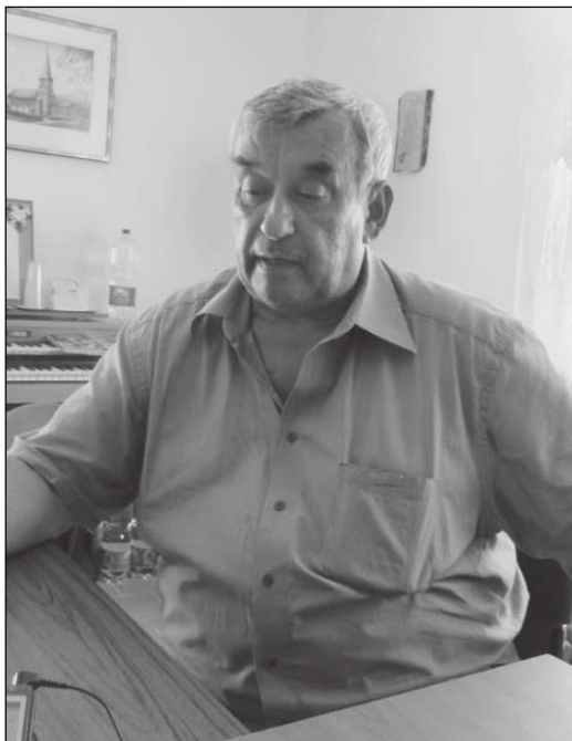
Nyugdíjba vonulása után nejével Váradon találtak otthonra és befogadásra

– Amikor nyugdíjba mentem, a történelemmel kapcsolatos szálaim és kapcsolataim nem szakadtak meg. Döntés előtt álltam, hogy mit csináljak a továbbiakban. Körülnézve rádöbbentem, hogy teológusaink vannak bőven, de a történelem terén nagyon szegények