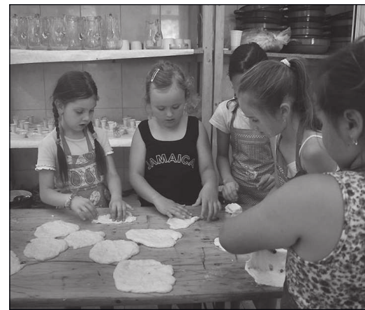
Így készülnek a finomságok.

Amikor több napon át végigsétálunk a különféle műhelyek között és odaülünk egy-egy foglalkozást vezető alkotó és kis tanítványaik közé, valósággal leesik az állunk a csodálkozástól. Hiszen annyi értéket gyűjtöttek össze erre a hétre a szervezők, amelyekről a legtöbbször már nem is gondoljuk, hogy léteznek, és hogy főleg érdekelnek is valakit. A másik nagy öröm: az elmélyülten dolgozó kis alkotók igyekezetét figyelni, mennyire bele tudnak mélyülni abba a világba, amely ma már egyértelműen nem jellemzi a mindennapjaikat, de az érdeklődés ennek ellenére adott.