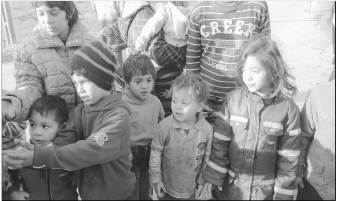
A NYOMOR ÖRÖK ADVENTJE – MINDIG VÁRNAK VALAMIT

Vajon a mélyszegénység egyúttal mélyreménytelenséget is jelent? Akár éveken át kereshető a kérdésre a válasz, főként az olyan országos szinten is szegénynek számító régióban, mint amilyen felénk például az Érmellék, melynek településein nagyszámú roma populáció él, ahol a mélyszegénység adott és egyértelmű. Tagadhatatlan tény. A mélyreménytelenség azonban talán mégsem. Merthogy vannak arcok és sorsok, amelyeken ez egyértelműen, jól láthatóan kiütözik. Másokén meg kevésbé vagy egyáltalán. Talán a nyomor megszokottsága, fásultsága és magától értetődöttsége teszi? Ezek szerint a mélyszegénységben is tud nevetni és örülni az ember? Nehéz ezt átérezni. Hiszen a posztmodern kor embere attól is könnyen kétségbeesik, ha elveszíti a bérletét, elejti a telefonját, vagy éppen leenged az autója kereke. Magyarán: az úgynevezett apró kellemetlenségek is könnyen felborzolják a kedélyünket, és beletaszítanak a remény nélkülségbe, a depresszív állapotba. A digitalizáció kábeli és hatásai által megkötözött életünk, az úgynevezett szétfejlődés ellentétes pólusaiban egyre nagyobb talány számunkra a mélyszegénység