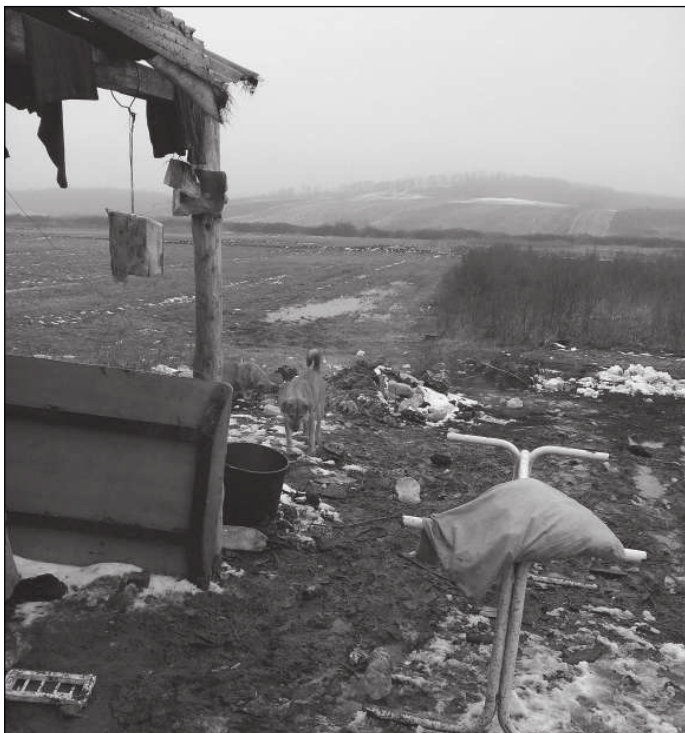
EBUGATTA VIDÉK, AHOLO A KUTYA KERESI A VACSORÁJÁT

Jézus belép Samáriába, amit az övéi jobbnak látnak kikerülni. Odamegy és megszólít, beszédbe elegyedik. Fesztelen és egyszerű szavakkal oldja a feszültséget, még pontosabban: nem is vesz tudomást ezekről az emberi kötöttségekről, válaszfalokról, amit mi olyan szigorúan be- és megtartunk, valósággal ragaszkodunk hozzájuk, mert beléjük szocializálódunk. Meglátatja a reménységet azzal, aki már nem mer reménykedni sem. Mert a remény nagy luxus, alap, kiindulópont, Istenhit szükségeltetik hozzá. Lehet, nagy szavak ezek, de az egyház társadalmi és missziói felelősségvállalása ugyanezt a krisztusi példát és reménységet hordozhatja járatlan utakon, a reményt, de még a reménytelenséget sem ismerő, sorsukba beletörődött, szikkadt lelkű embereknek. Akik talán maguk sem tudják, hogy várnak valakit.