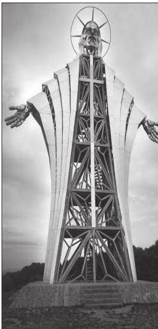
KRISZTUS-SZOBOR. FÉNYKÉPEZTE ÁBRÁM ZOLTÁN

Ennek a korszaknak Jézus Krisztus feltámadása vetett véget. Isten a halált és a vele-